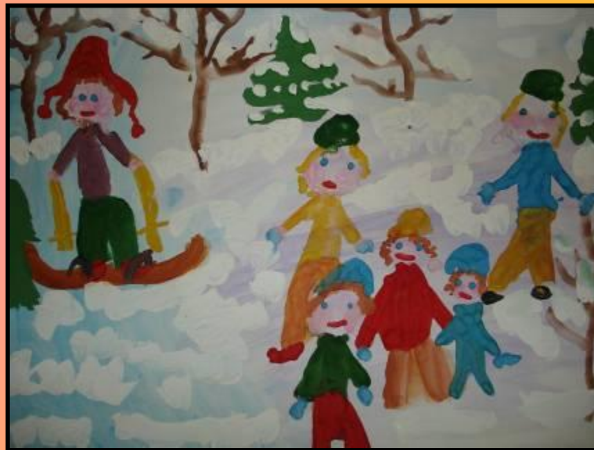
«Моя семья на прогулке»