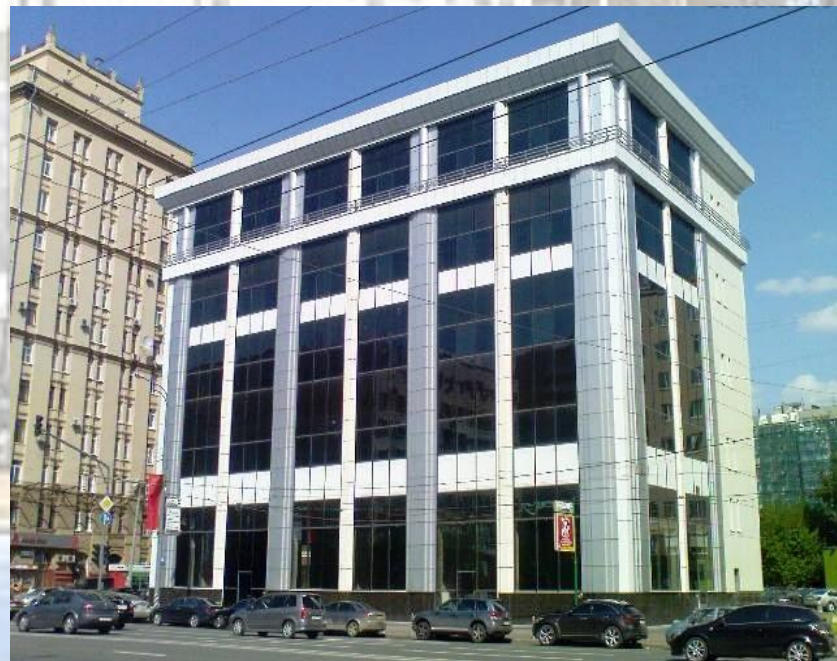
Гаражный комплекс с элементами автосервиса на 201 м/м, ул. Проспект Мира д.64