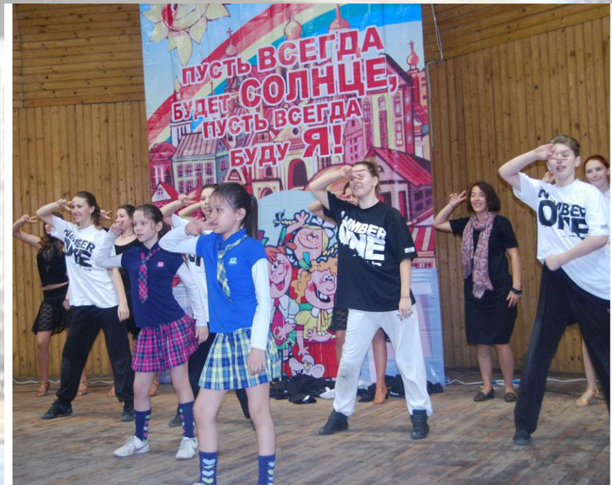
Праздничный концерт посвященный дню защиты детей

В 2011 году планируется провести капитальный ремонт в 2 досуговых учреждениях.