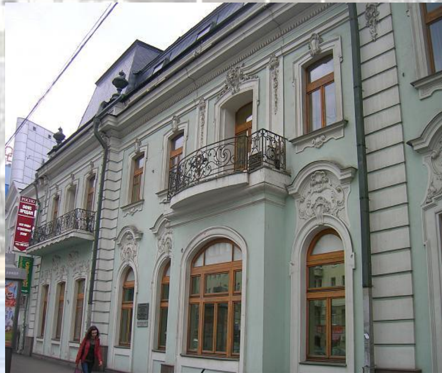
Памятник культурного наследия