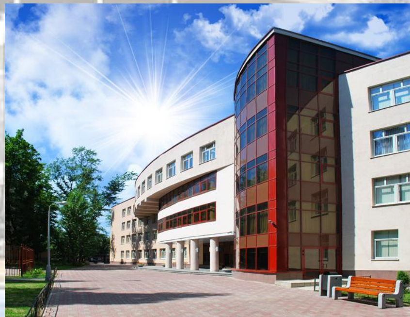
ГОУ СОШ №268, ул.Гиляровского д.21