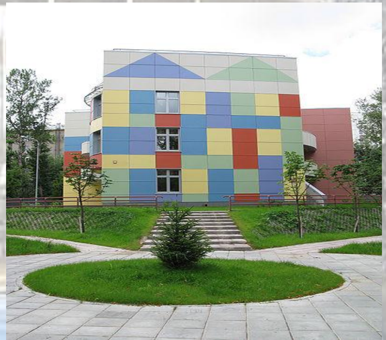
Детский сад №1021