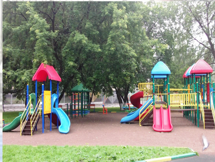
Детская игровая площадка Большая Переяславская д.6