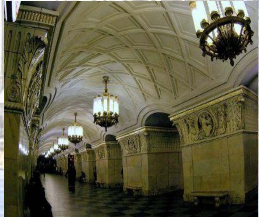
Вестибюль станции Проспект Мира (кольцевая)