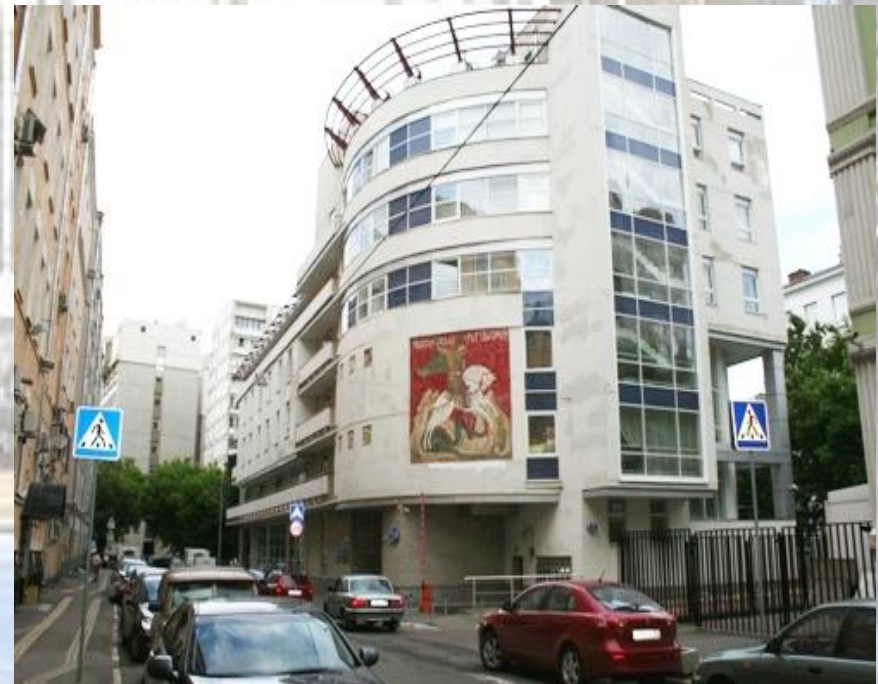
КЦСО «Мещанский», Переяславский пер. д.6