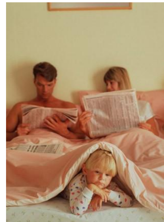
NRS Россия (все города 0+) май-октябрь'06