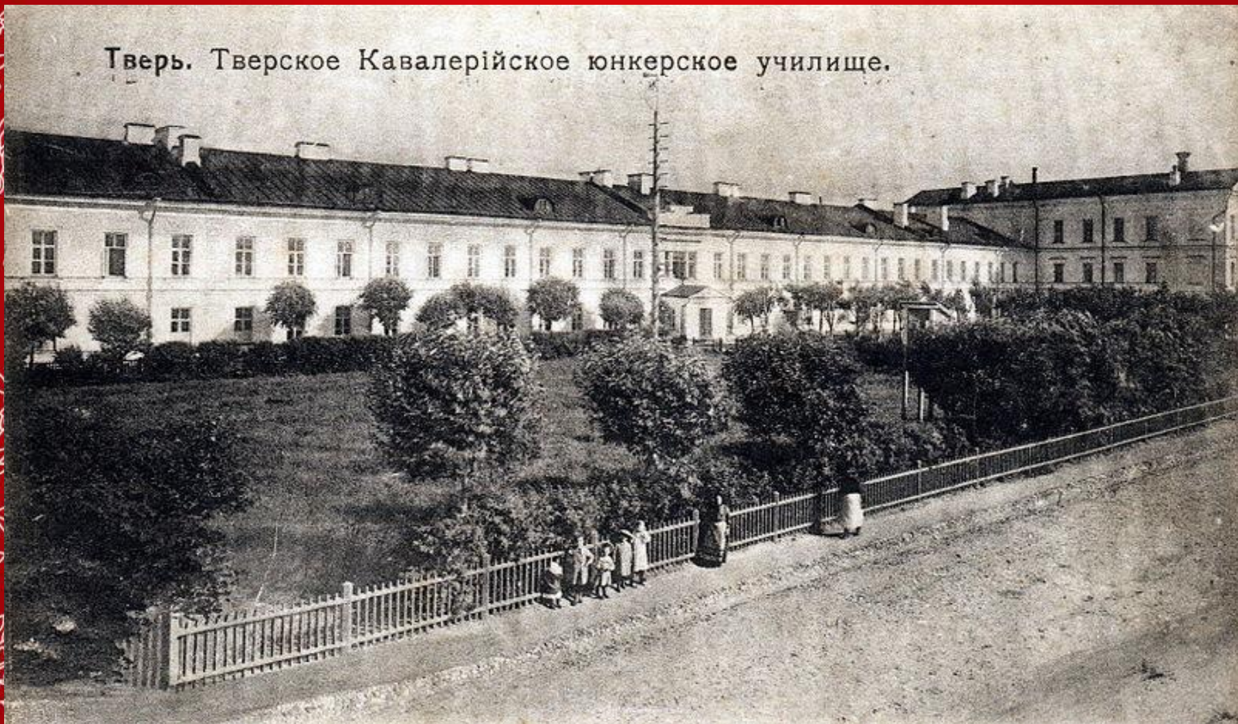
Тверь. Тверское Кавалерійское юнкерское училище.