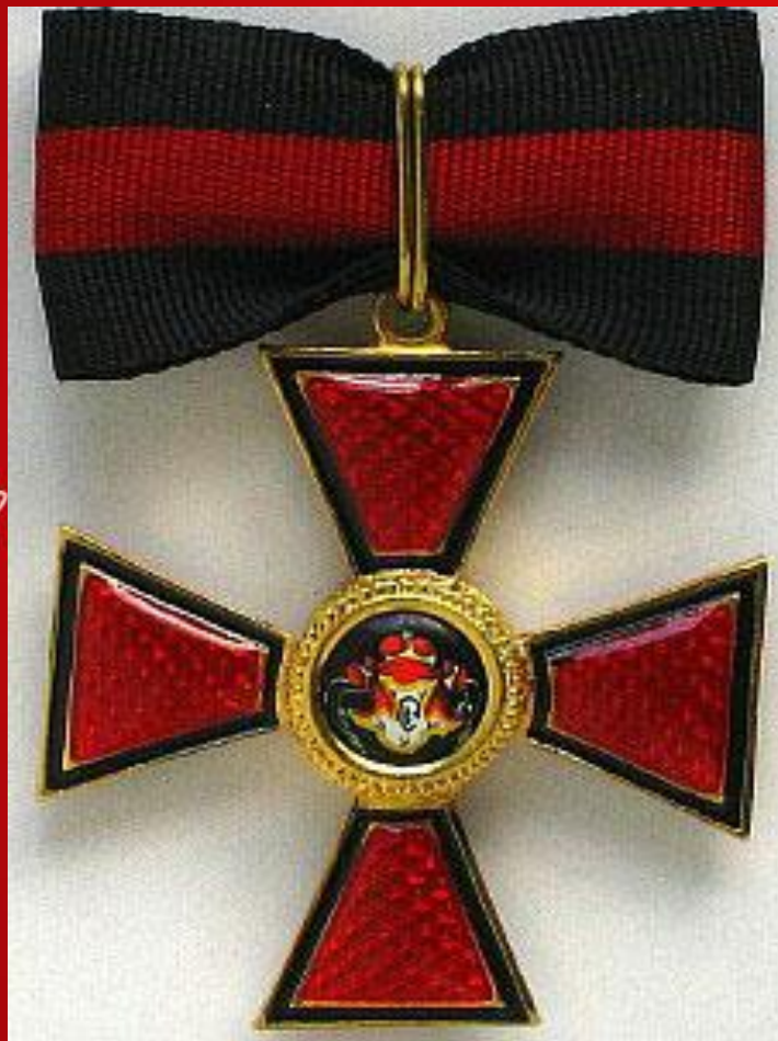
Орден Святого Владимира III степени