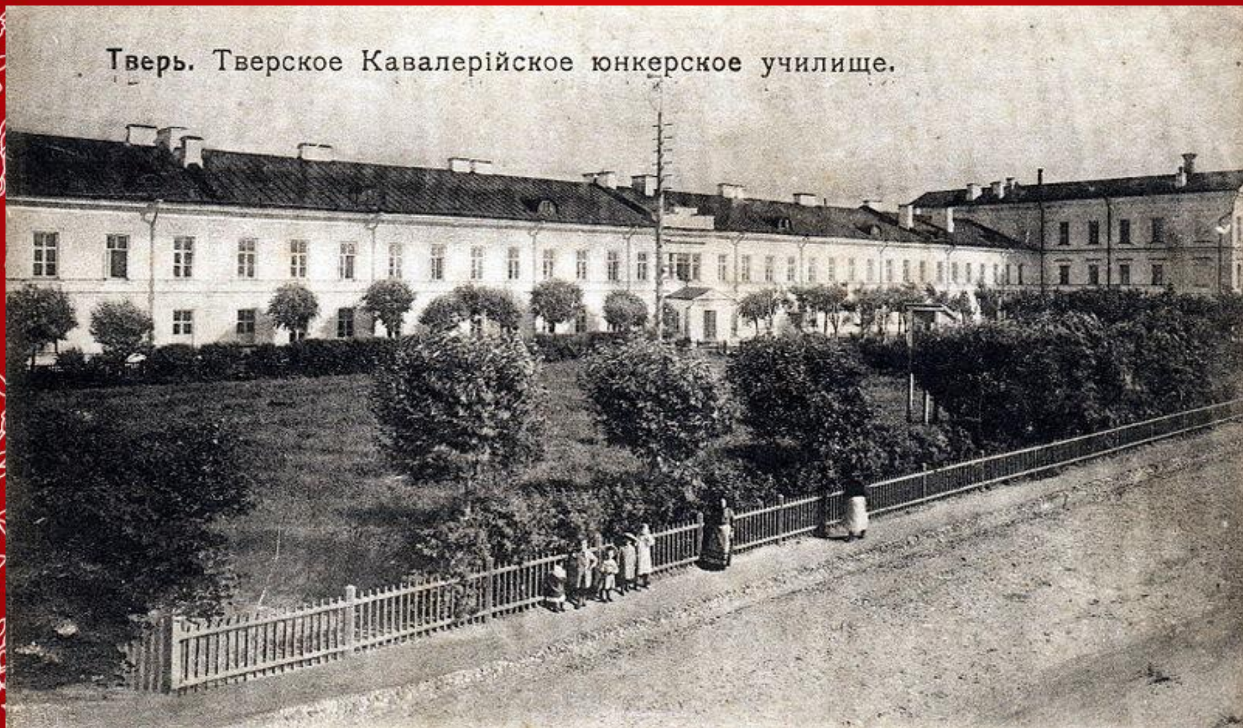
Тверь. Тверское Кавалерійское юнкерское училище.