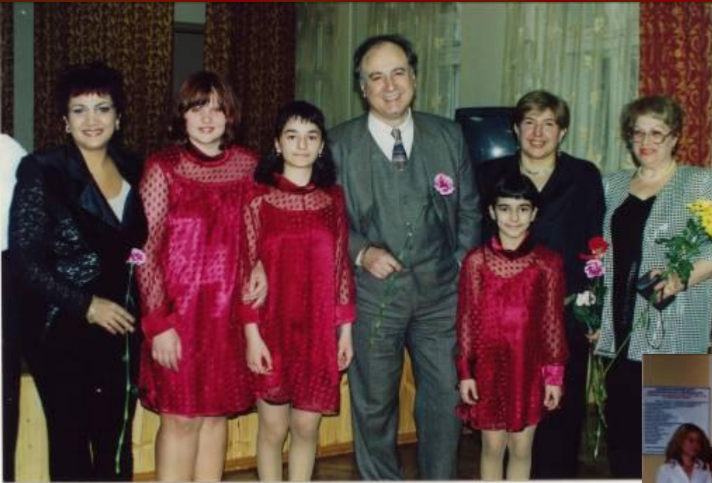
Визит посла республики Армении А.Смбатяна