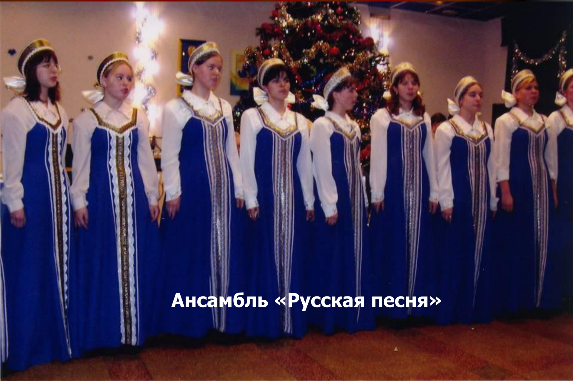
Ансамбль «Русская песня»