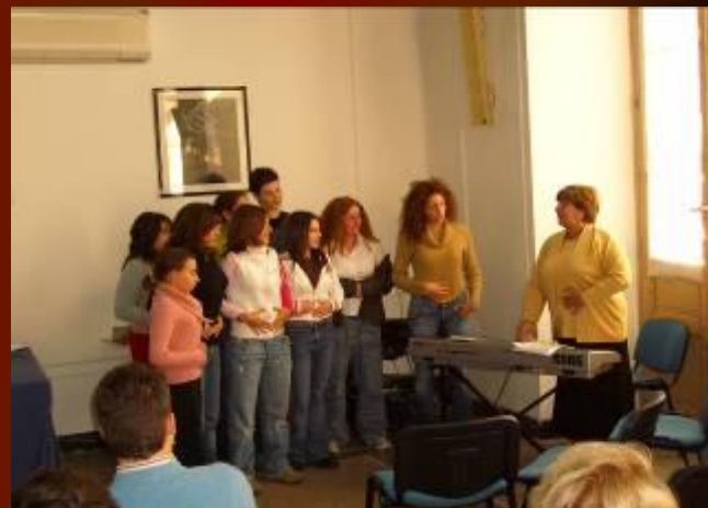
Впервые в этом году были проведены мастер-классы в которых участвовал ПКЦ