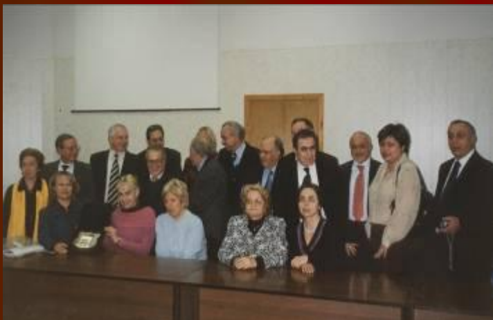
Международная конференция в Италии 2003 г.