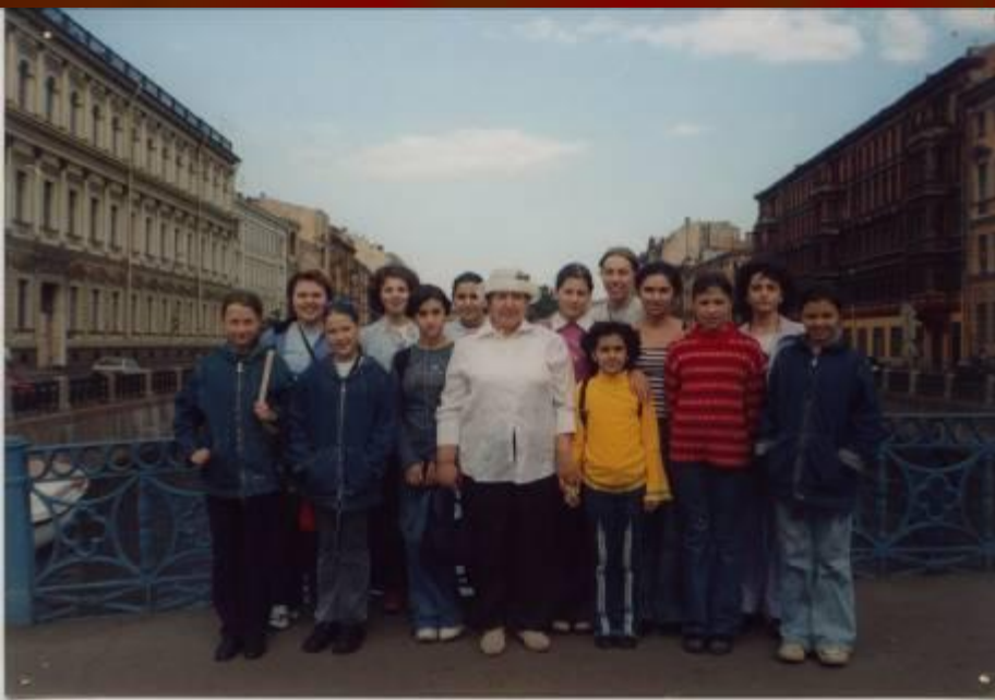
Творческая смена ансамбля «Дружба» в Санкт-Петербурге.