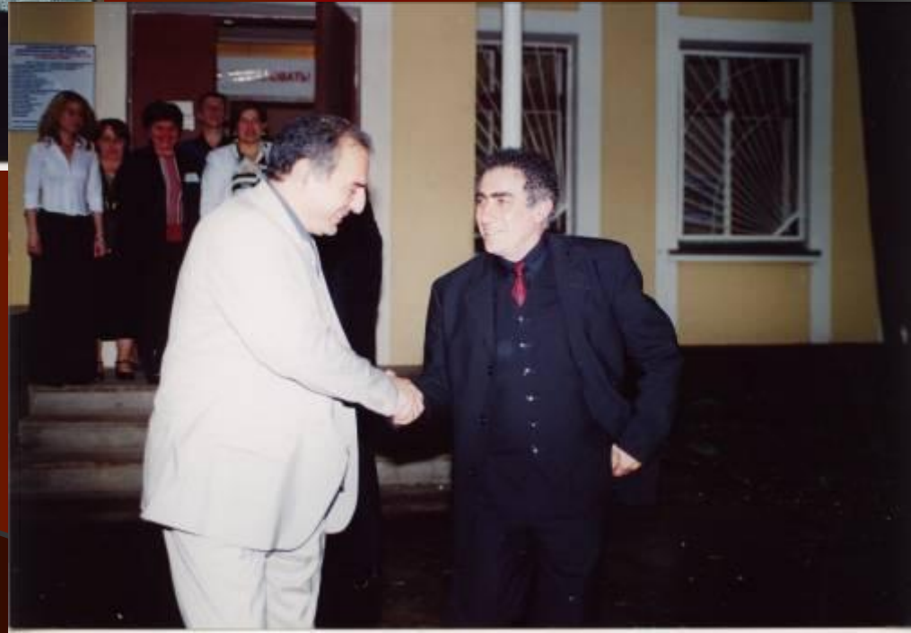
Встреча с сыном композитора А. Бабаджаняном