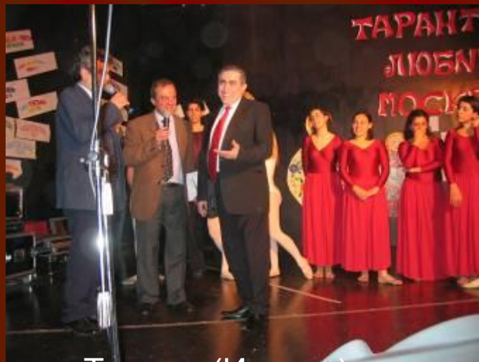
Фестиваль в Таранто(Италия)