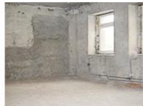
шоссе Энтузиастов, д.51 (161,7 кв.м)