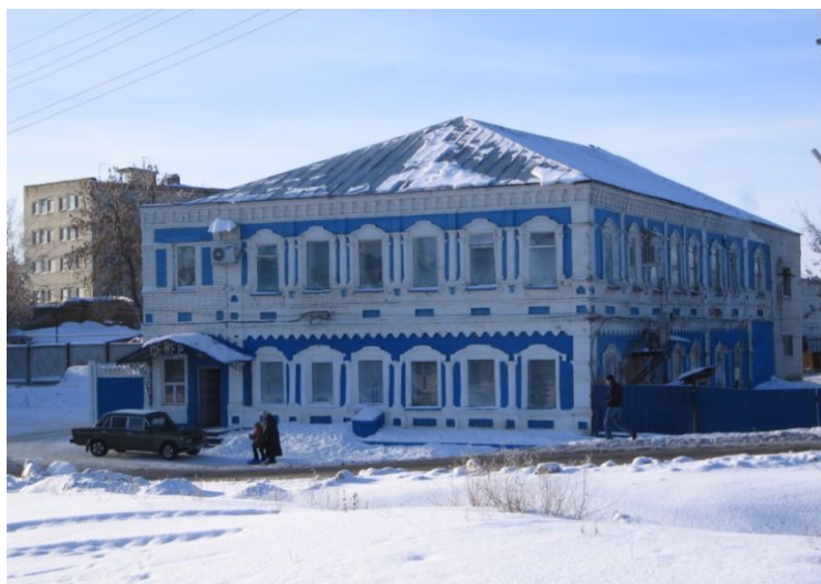
Дом купцов Абросимовых