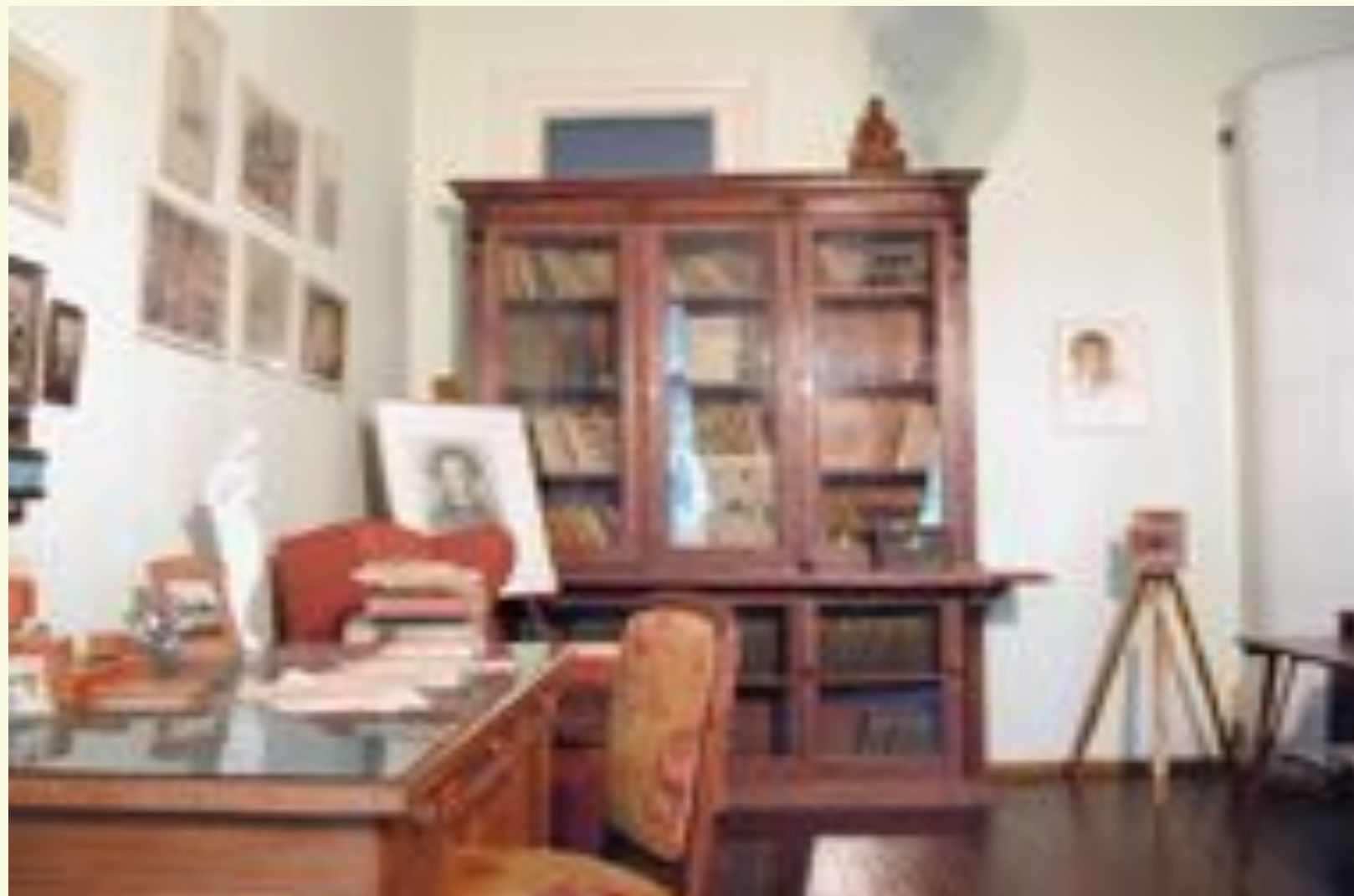
Кабинет Н.И. Пунина