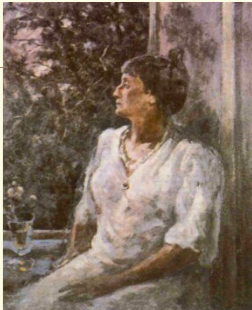
Портрет Ахматовой на фоне Шереметевских лип работы Александра Александровича Осмеркина