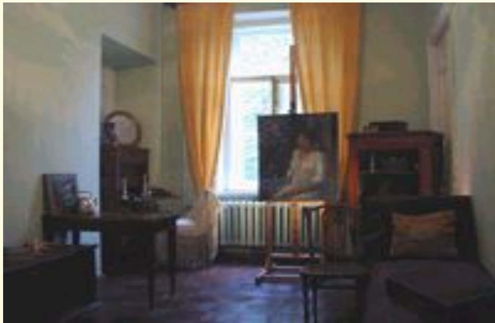
Комната Анны Андреевны Ахматовой