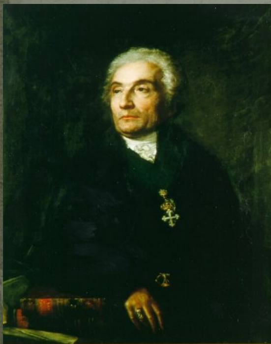
Ж. де Местр

Поиск «христианского ответа Французской революции», создание для этого «внутренней», мистической церкви, объединив католиков, протестантов, масонов и сектантов.