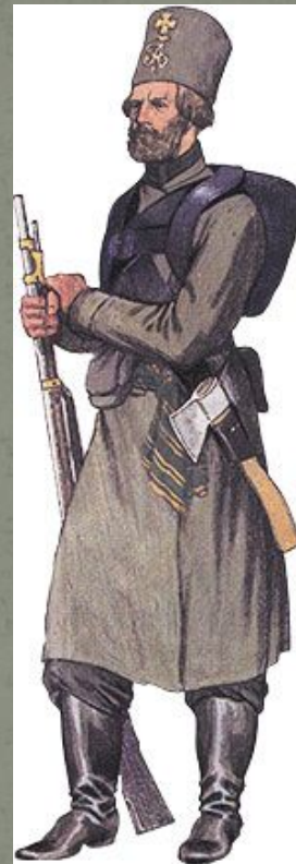
Ратник Московского ополчения

Основа ополчения - крестьяне, горожане, местные дворяне. Ополченцы участвовали в Смоленском, Бородинском сражениях, затем вошли в состав регулярных войск. В ней охраняли обозы, использовались как санитары, саперы, разведчики. В составе Московского ополчения поэт В. Жуковский («...в это время всякому должно быть военным»).