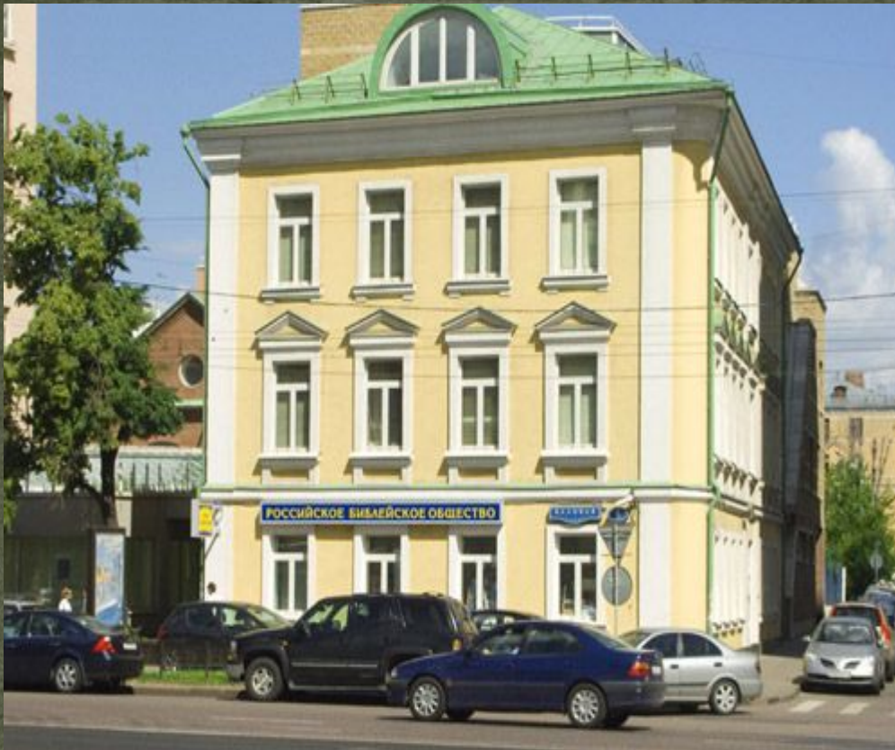
Библейское общество (1813 г).

Опорами общехристианской цивилизации должны были стать Теологический институт (1810) и Библейское общество (1813). В Европе эта роль предназначалась Священному союзу, который объединил бы народы в единое религиозное сообщество.