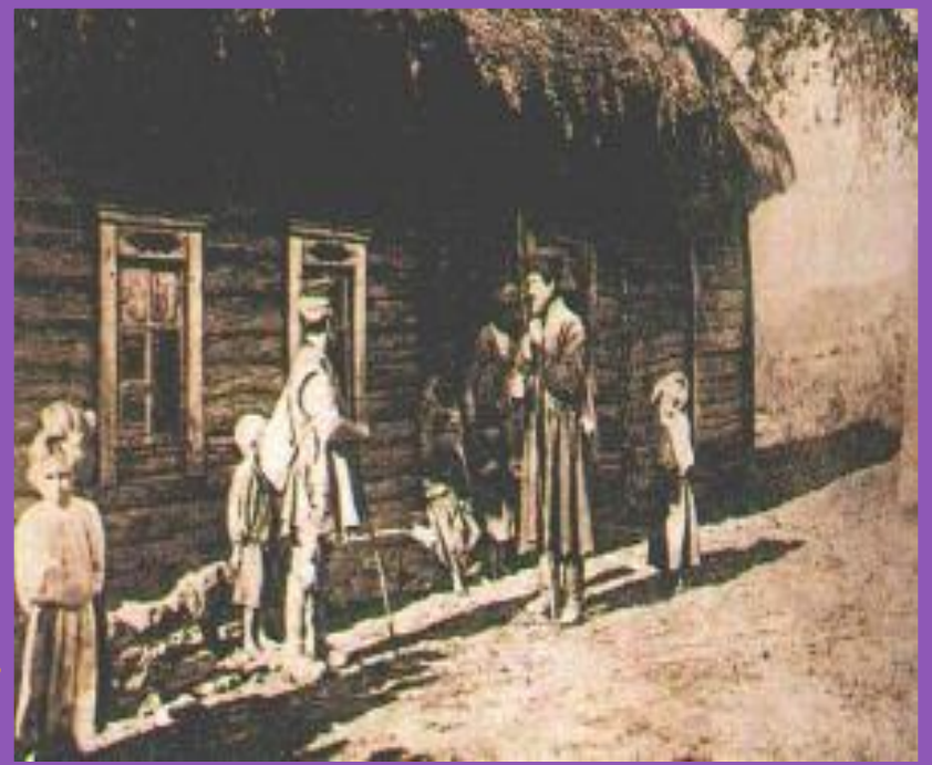
Крестьянский дом. (фото к.19 века.)