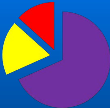
Типичное распределение заказов по способам закупок