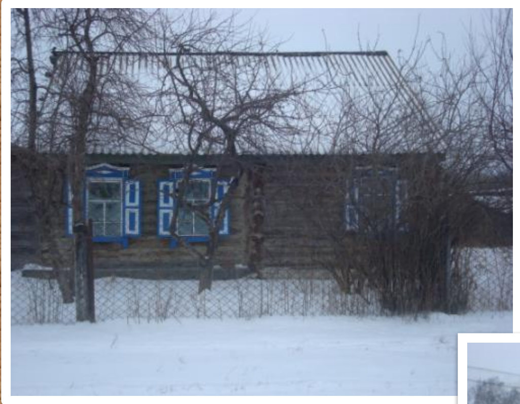
«Облегчённый» дом — пятистенок