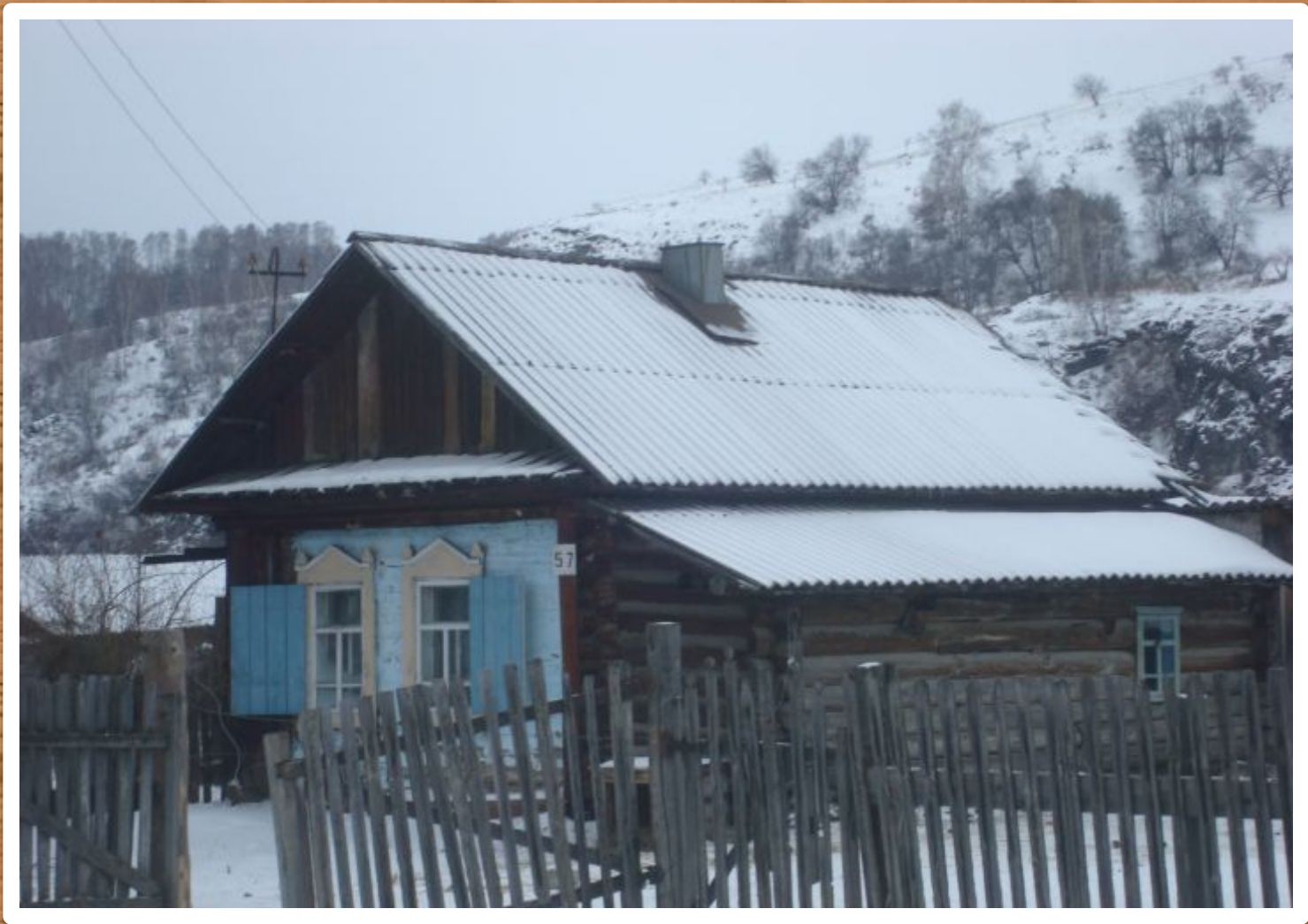
Двухкамерные срубные постройки