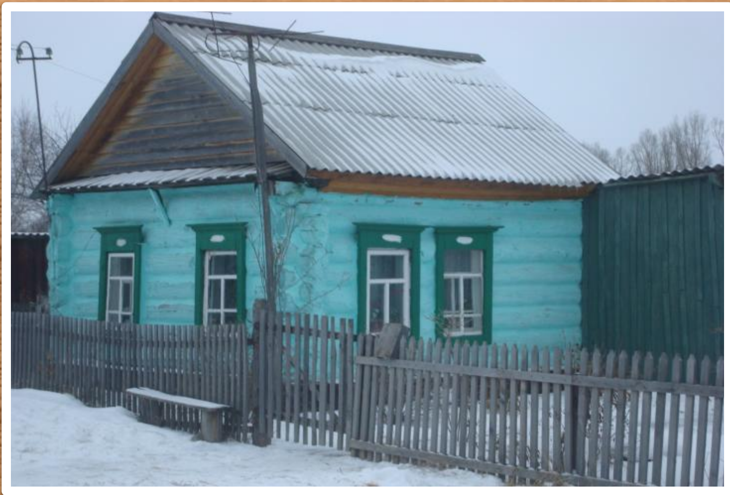
Дом – одностопок (одноколок)