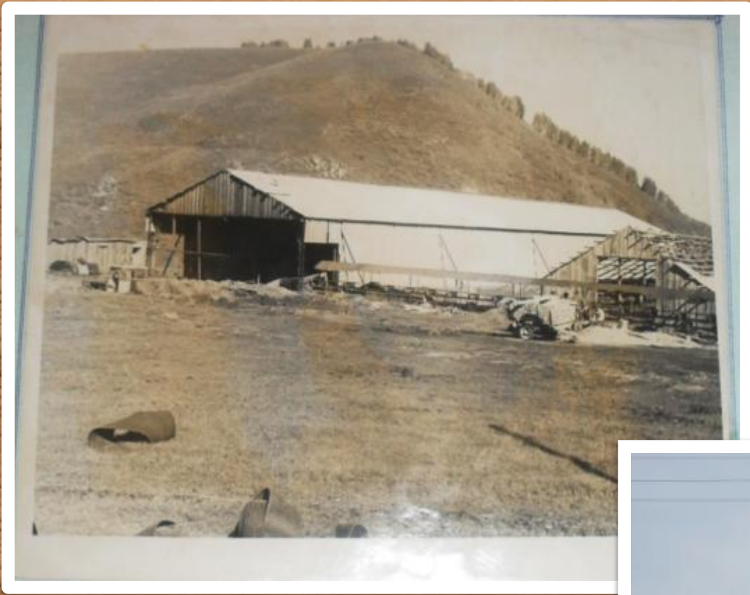
Кирпичный завод в селе Ая (1980-1990 г.г.)