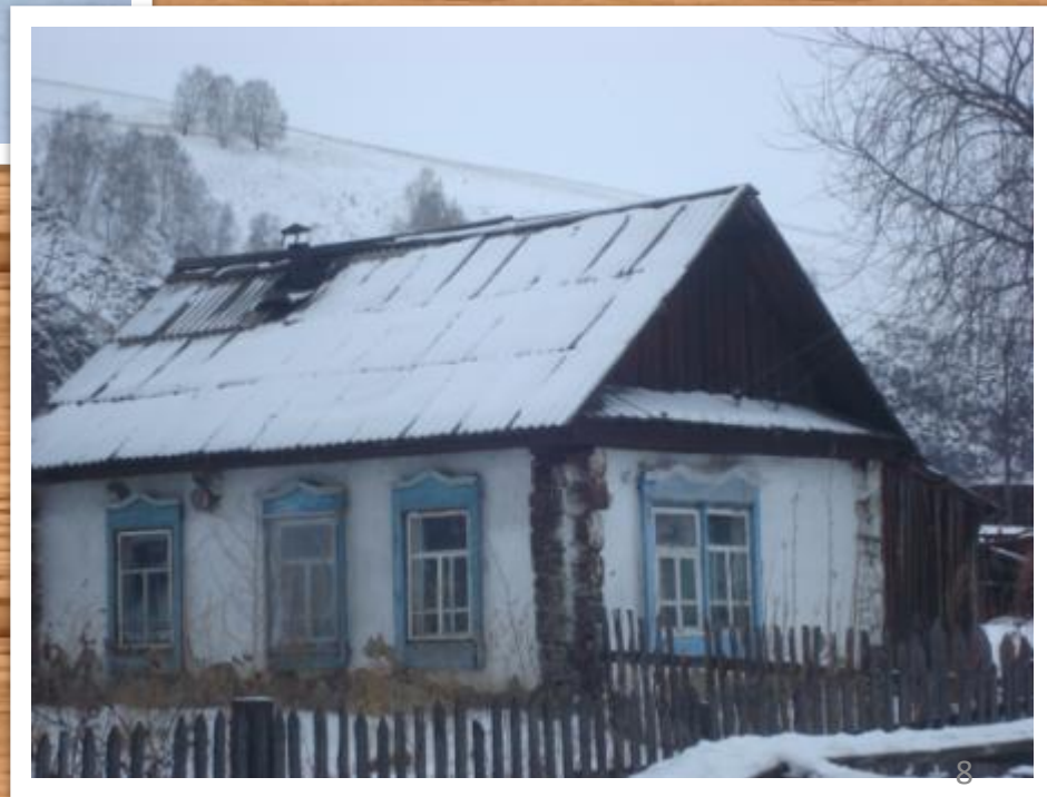
Дом — пятистенок