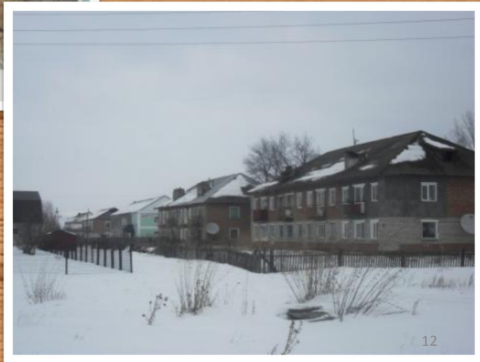
Улица 70 лет Октября (современный вид)