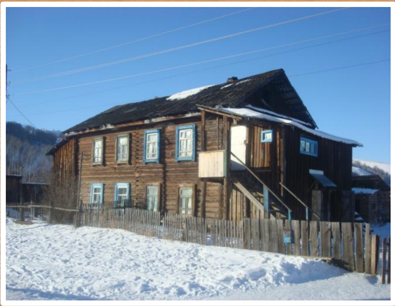
Двухэтажный деревянный дом