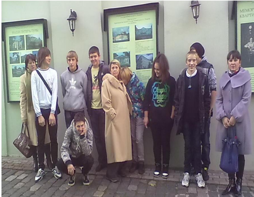
В Мемориальном музее-квартире А.С. Пушкина на Арбате (октябрь 2011)