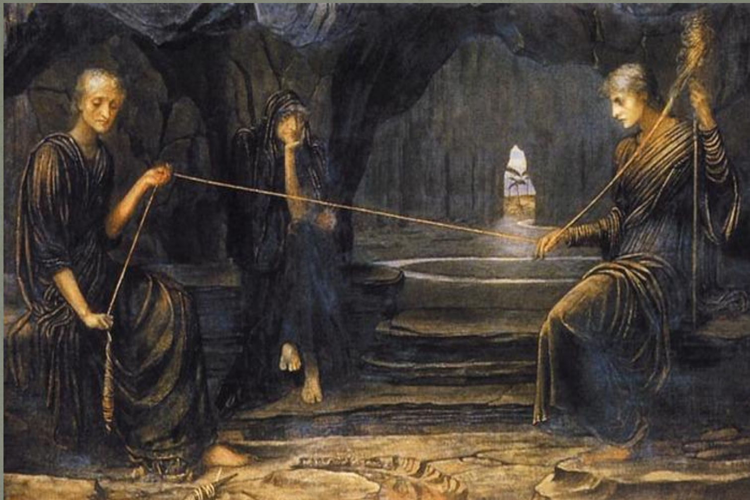
Мойры ,прядущие нить жизни.