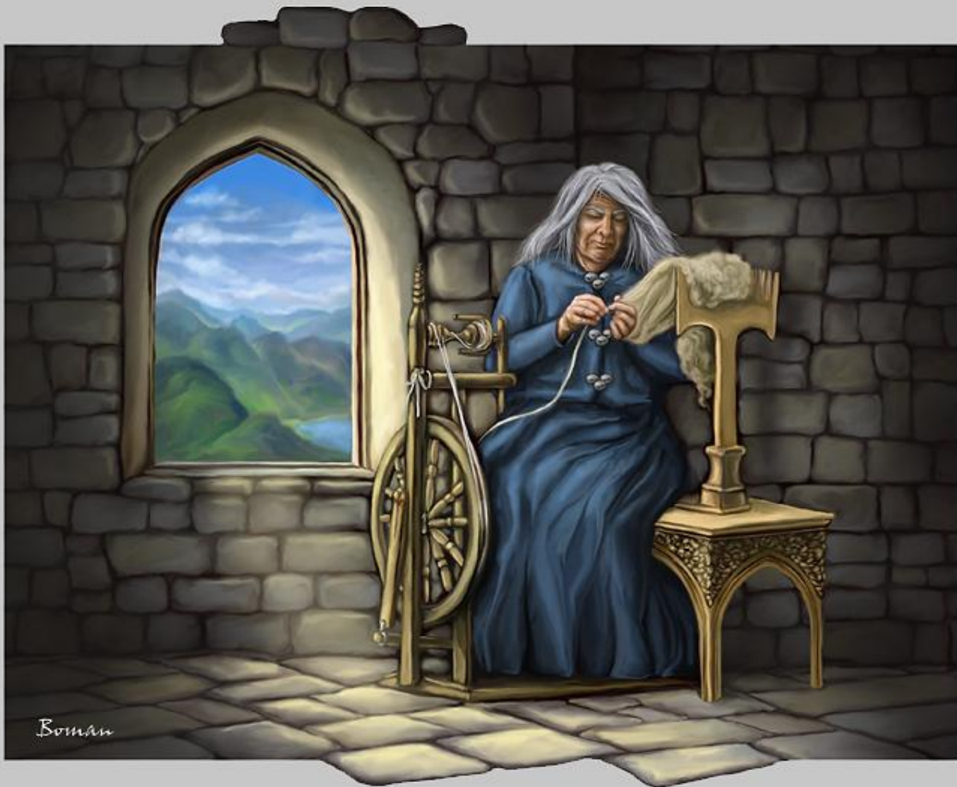
Норна. Одна из богинь судьбы.