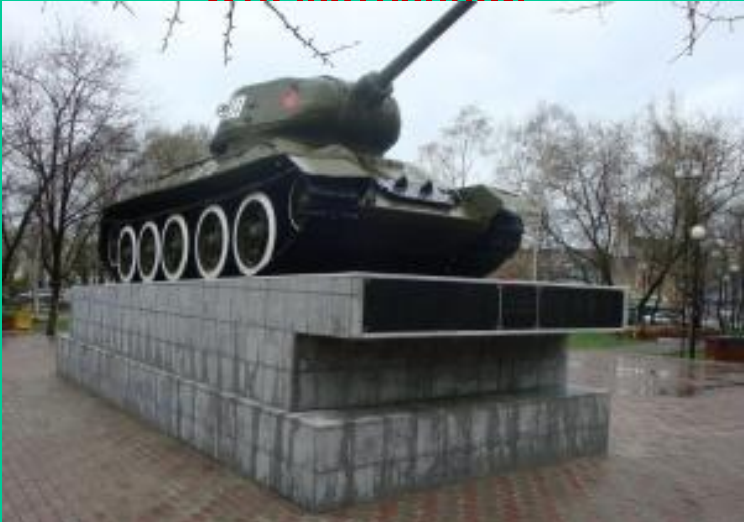
Памятник в честь танковой колонны «Приморский комсомолец»

Тысячи приморцев ушли на фронт добровольцами. Ими были укомплектованы экипажи, построенной на средства жителей края танковой колонны «Приморский комсомолец»