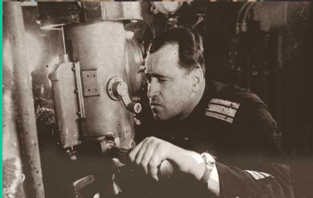
Г.И.Щедрин, капитан II ранга, Герой Советского Союза

Корабли и подводные лодки Тихоокеанского флота воевали на Северном и Черноморском флотах.