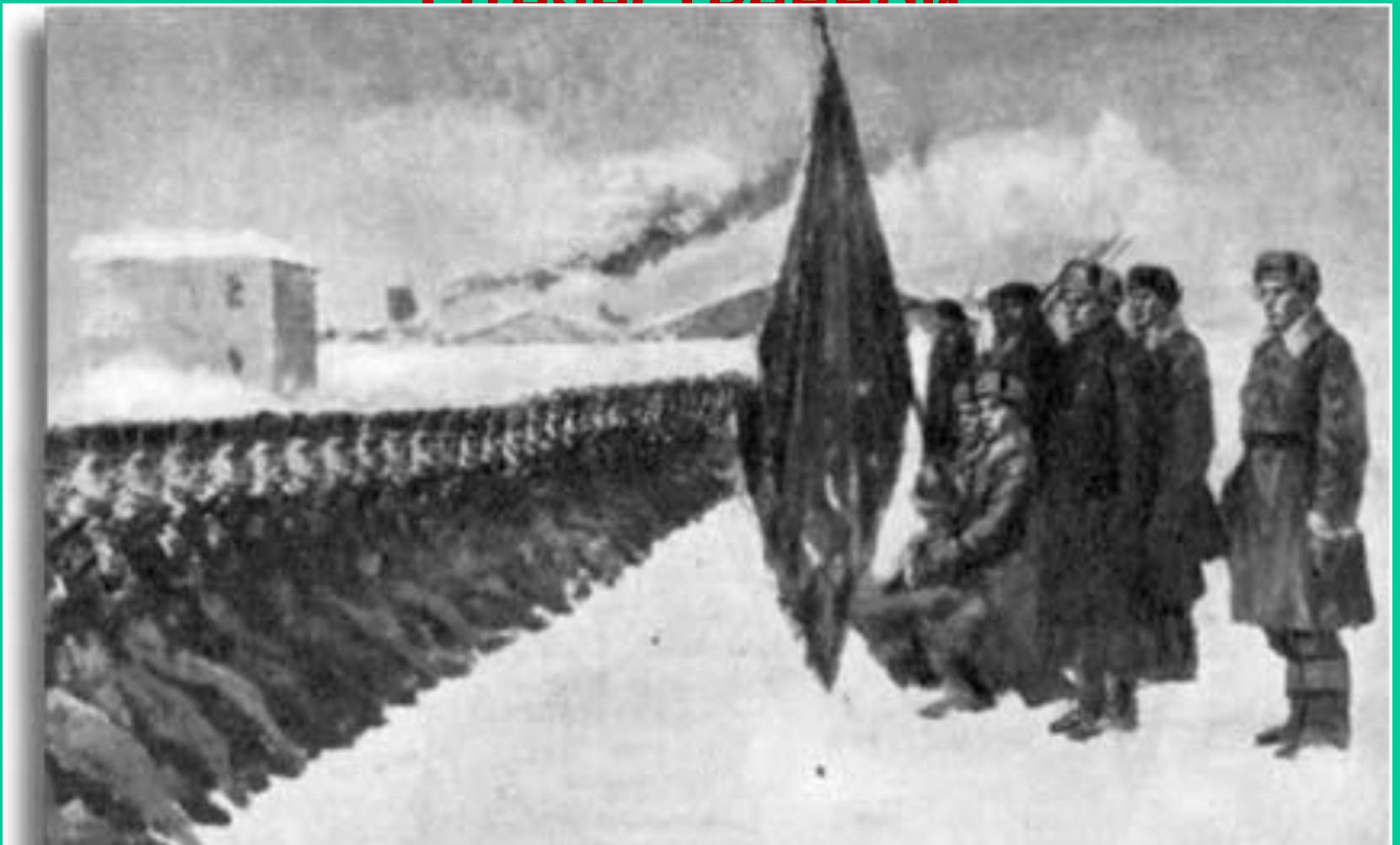
Воины-тихоокеанцы в битве под Москвой