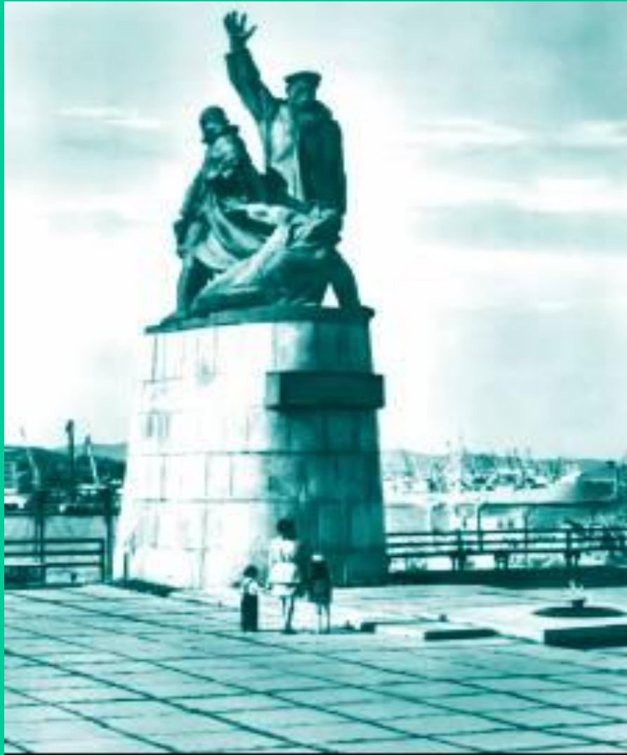
Памятник во Владивостоке морякам торгового флота, погибшим в годы Великой Отечественной войны