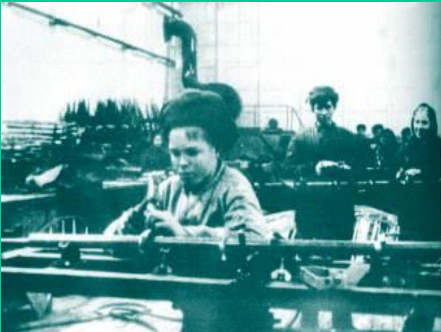
Авиационный завод в Арсеньеве. Подростки заменили отцов, ушедших на фронт