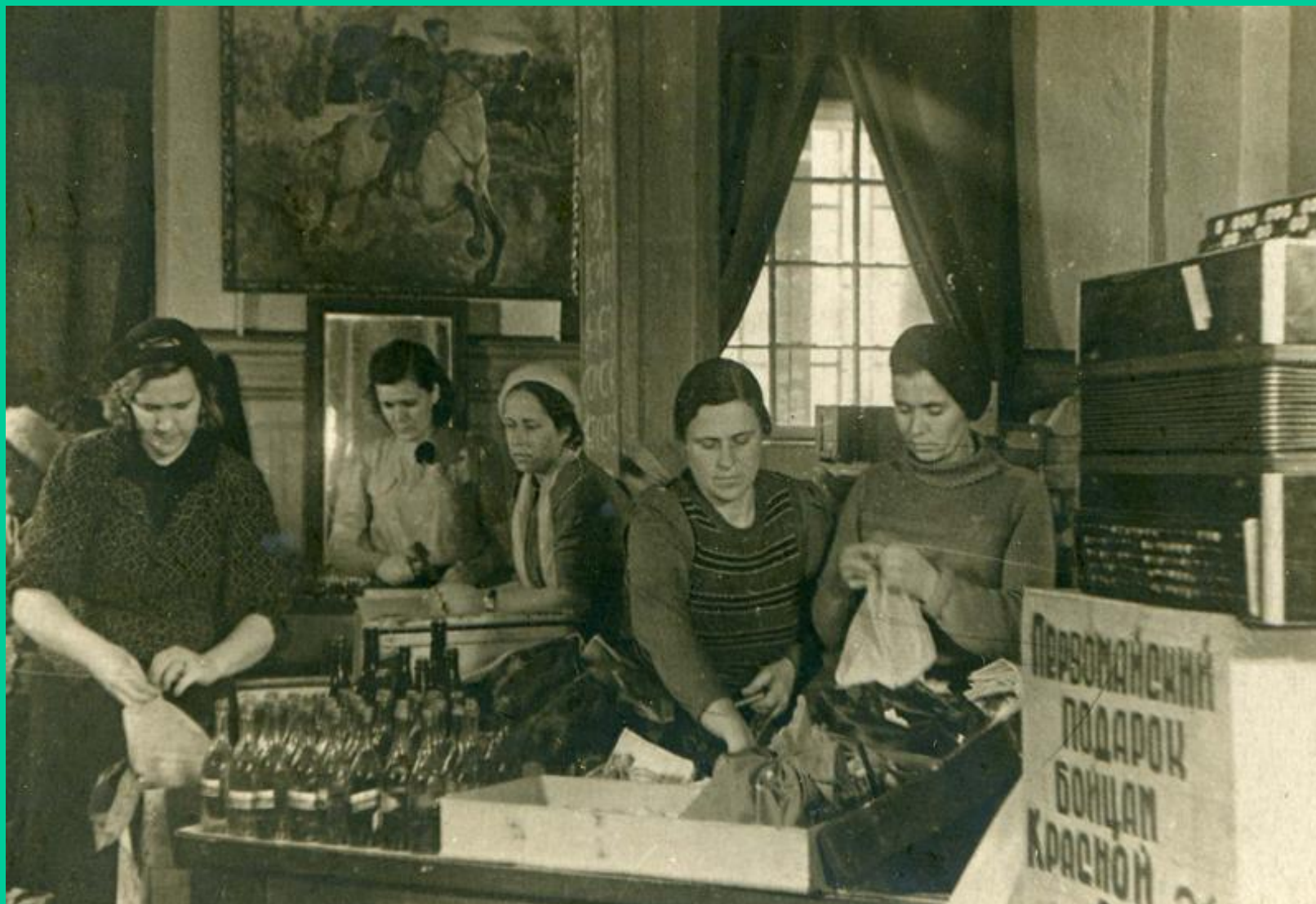
Сбор подарков на фронт