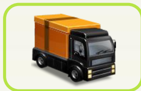
техника и оборудование