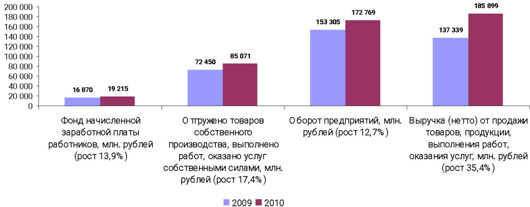
Динамика основных показателей деятельности СМСП 2009-2010