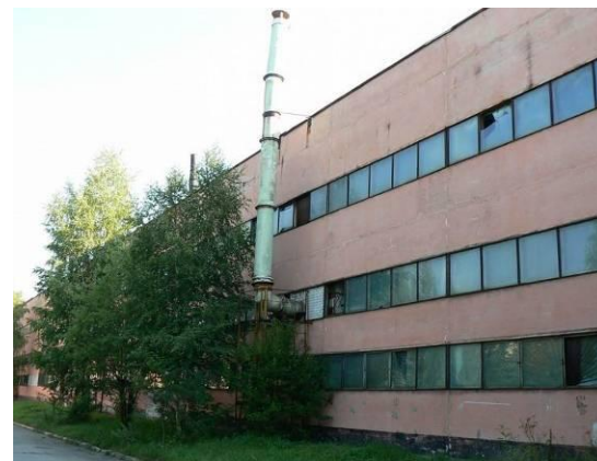
Здание цеха (ЦЭП 2)