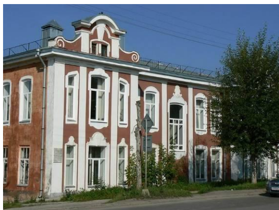
Здание проектного отдела