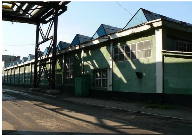
Здание цеха ЦОП