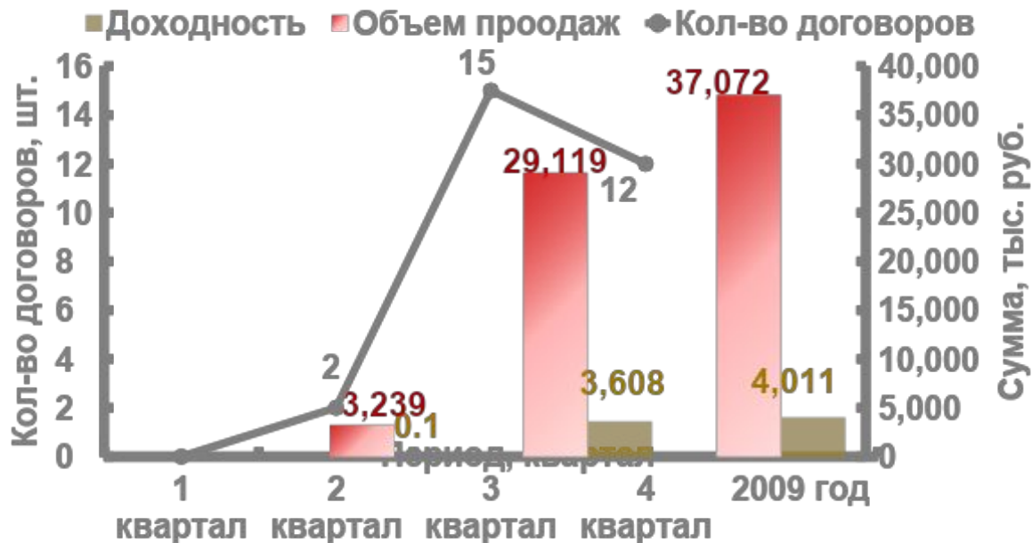
Объем продаж, доходность за 2009г.