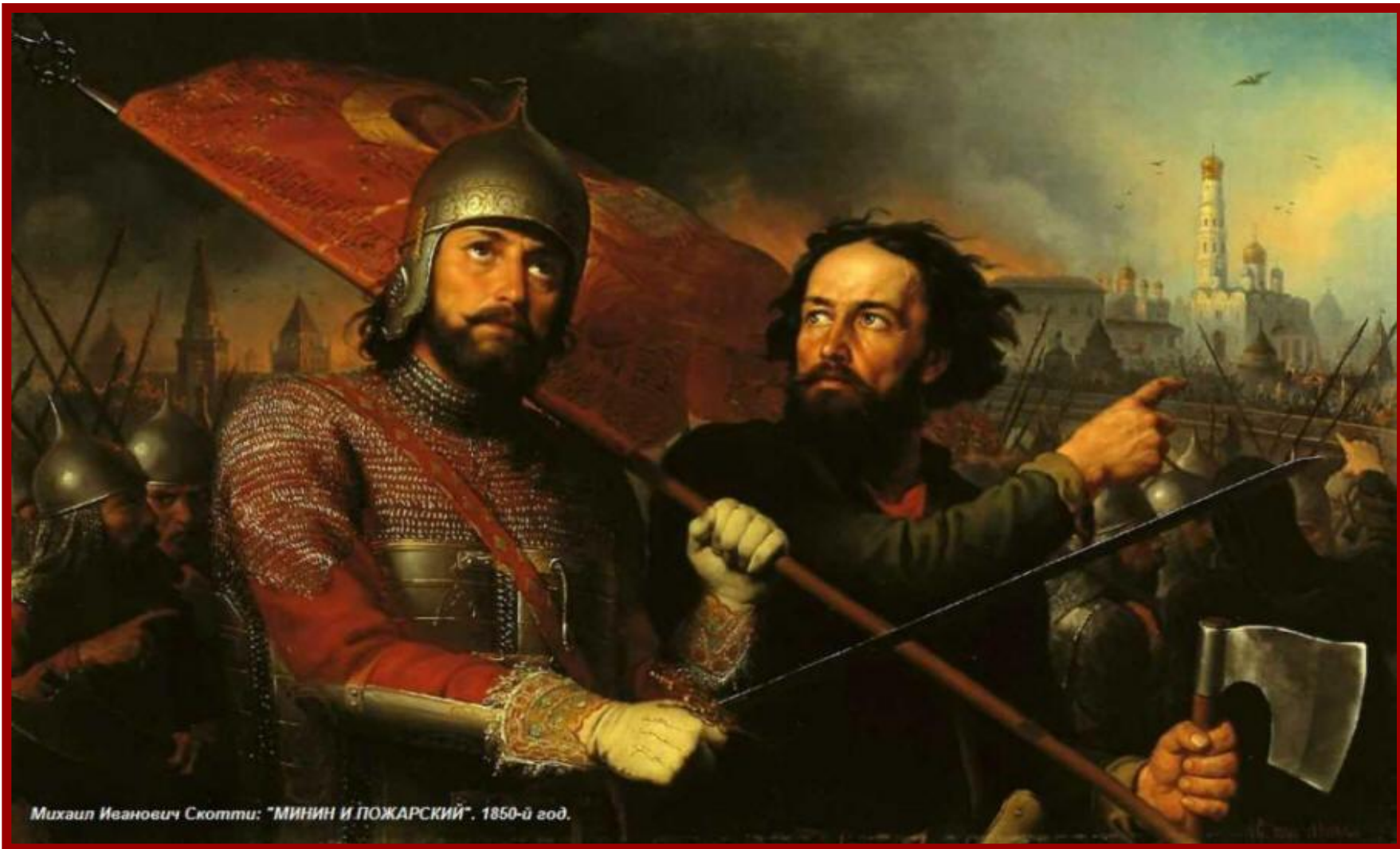
Михаил Иванович Скотти: "МИНИН И ПОЖАРСКИЙ". 1850-й год.