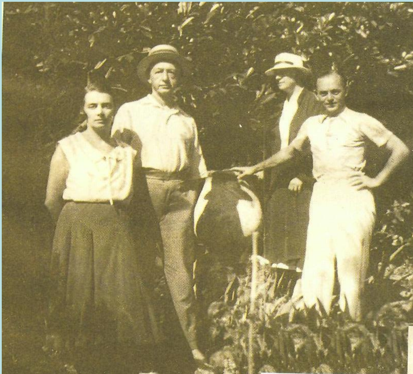
На отдыхе. Франция, 30-е годы