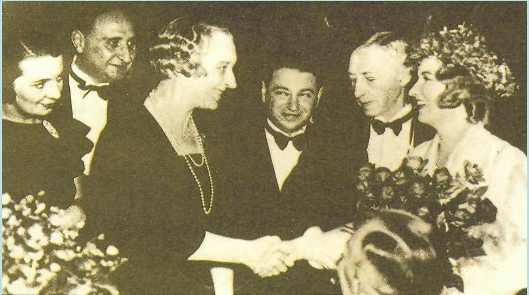
Стокгольм, 1933 г. – получение Нобелевской премии