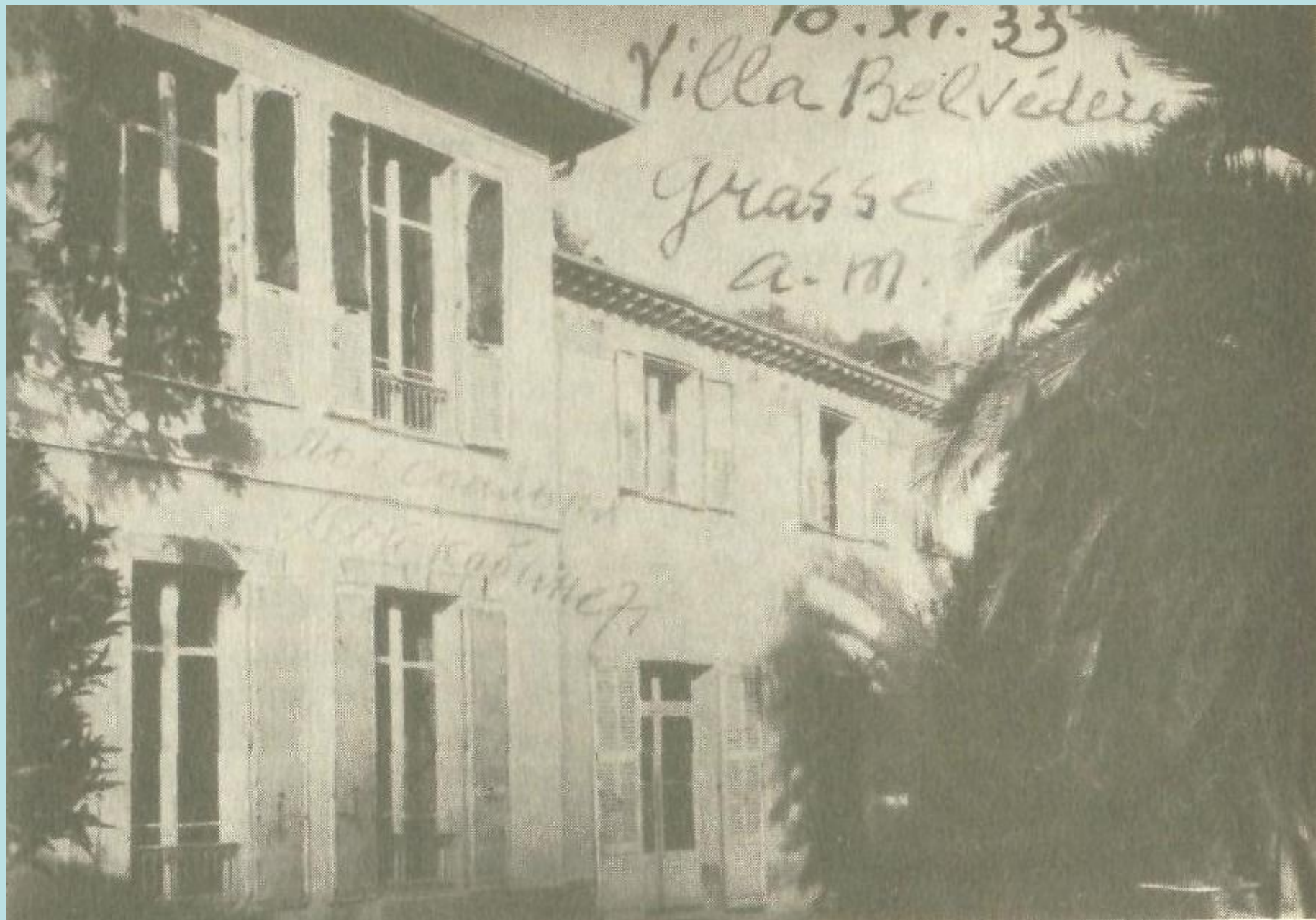
Вилла «Бельведер», под Ниццей. Грас, 1933 г.