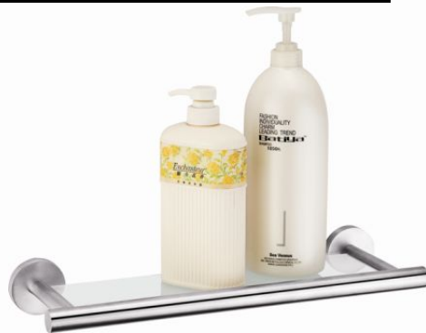
Код: 908019 размер 45x15 см