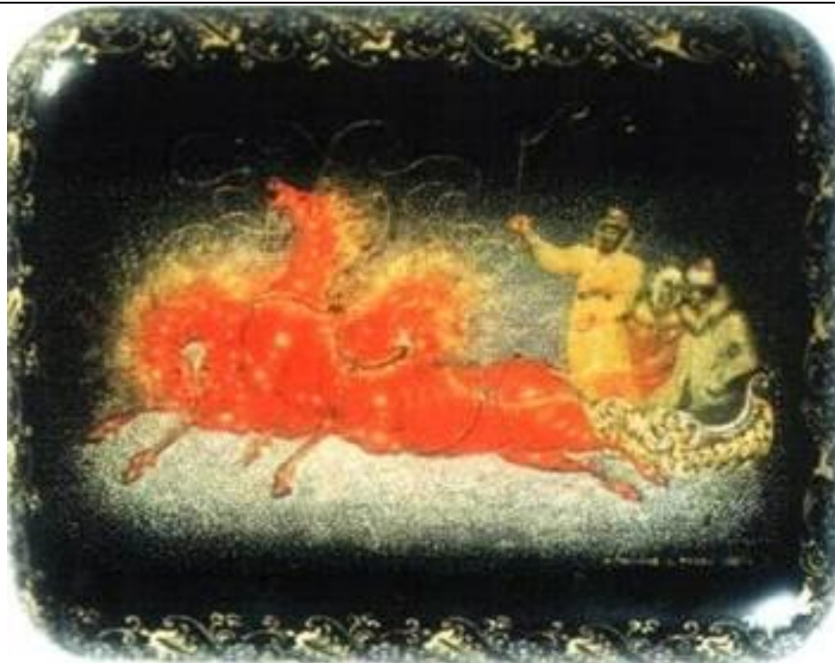
портсигар, 1927 год