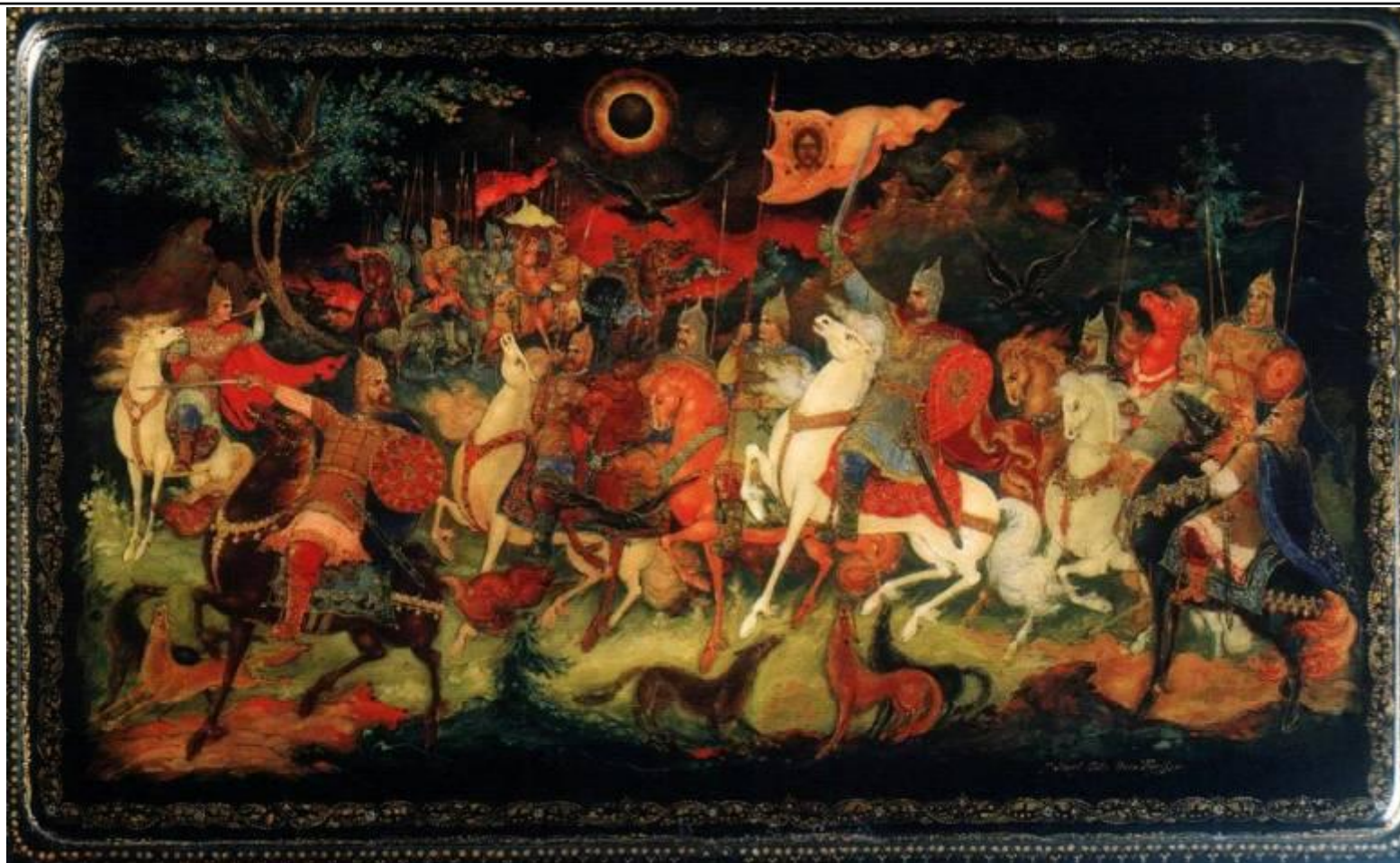
Крышка ларца, 1956