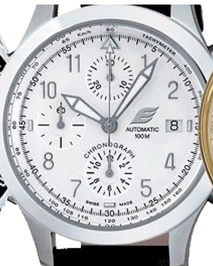
в виде накладного знака (серебро)