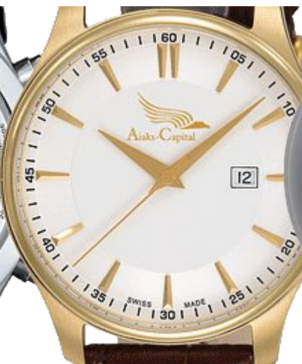
в виде накладного знака (золото)