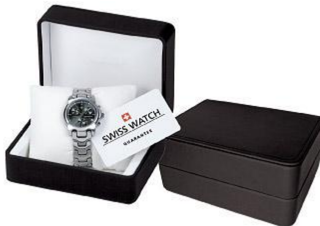
5. Deluxe Box black