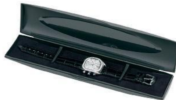
2. Black Box