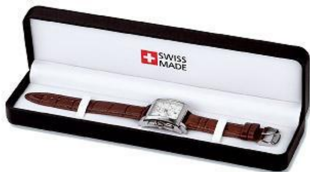
1. Deluxe Box black