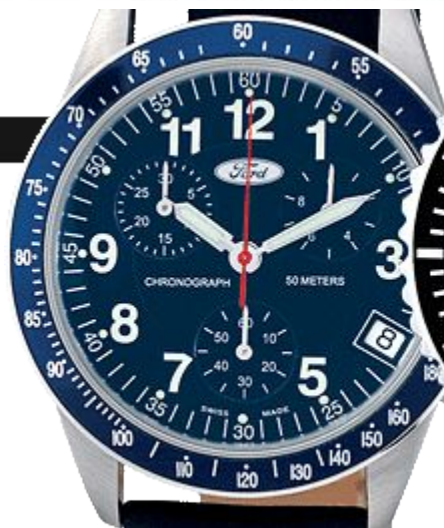
печать в один цвет