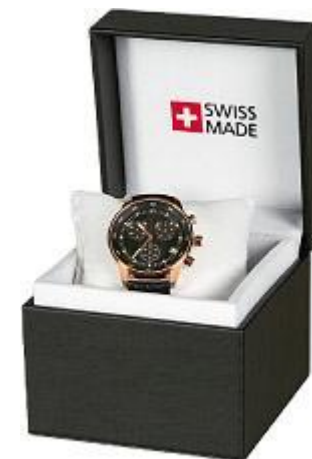
5. Deluxe black Cube