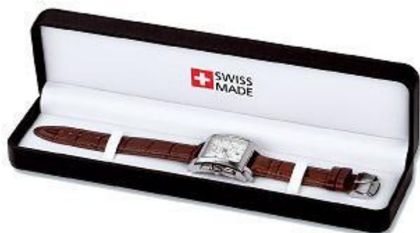
1. Deluxe Box black