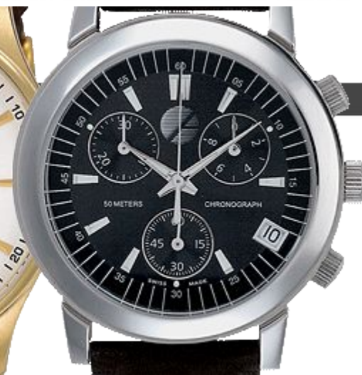
печать вывороткой (печатается все, кроме логотипа)