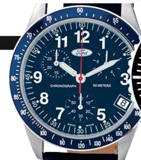
печать в один цвет