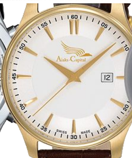
в виде накладного знака (золото)