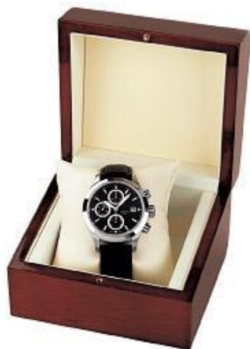
4. Wooden Box