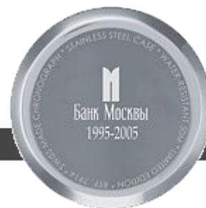
гравировка вывороткой (все, кроме логотипа)