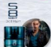
58 NIGHT Эс 8 Найт