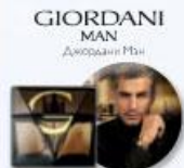
GIORDANI MAN Джордани Мэн

Мужская туалетная вода Giordani Man 75 мл.