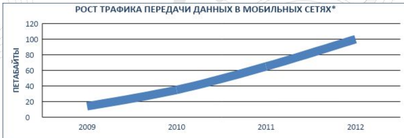
РОСТ ТРАФИКА ПЕРЕДАЧИ ДАННЫХ В МОБИЛЬНЫХ СЕТЯХ*