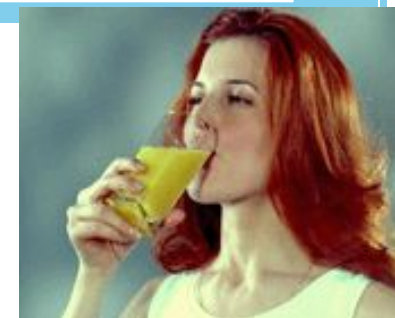
Сок «Золотая Русь»