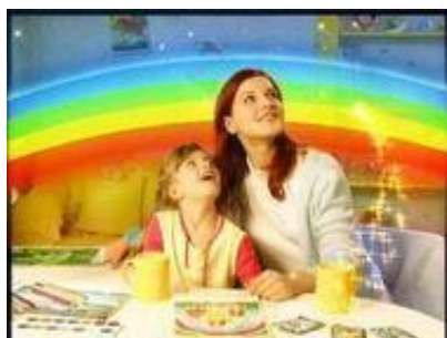
Какао «В Стране Чудес»