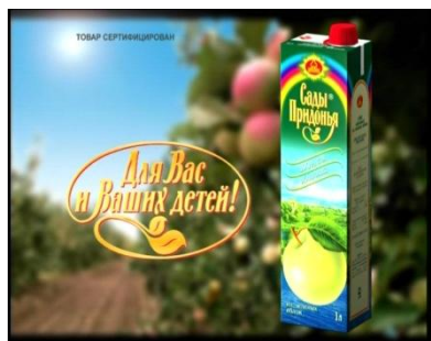
Сок «Сады Придонья»