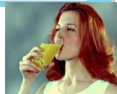
Сок «Золотая Русь»