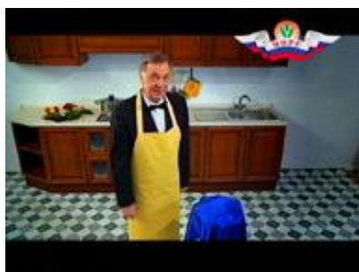
Продукты быстрого приготовления «Море»