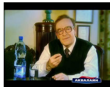
Звезда Эльбурская «Аквалайн»