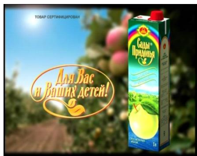
Сок «Сады Придонья»