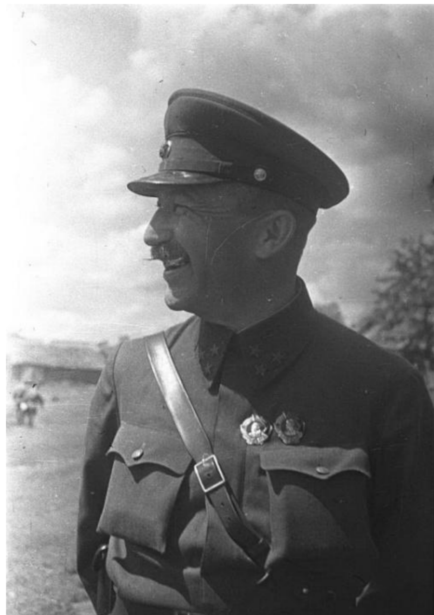
Генерал-майор П. А. Белов

27—30 ноября контрудар силами 1-го гвардейского кавалеристского корпуса (командир - генерал-майор П. А. Белов) и 112-й танковой дивизии (командир - полковник А. Л. Гетман) противник был отброшен на юг