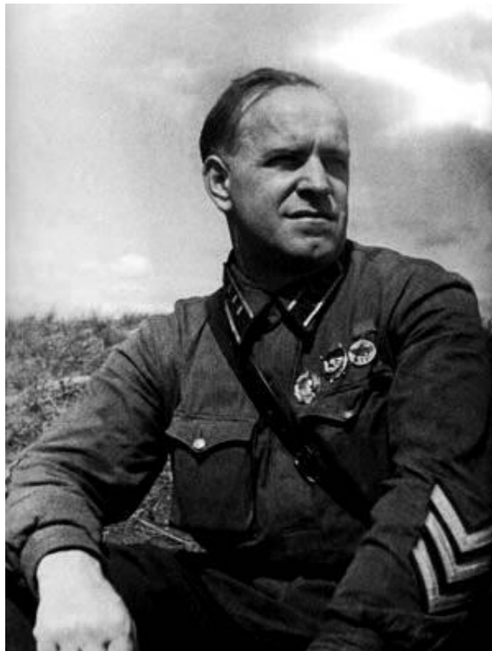
Войсками левого крыла Западного фронта командовал генерал армии Г. К. Жуков

30 октября — 1 ноября две танковые дивизии и одна пехотная бригада противника пытались лобовыми атаками овладеть городом. Врагу противостояли войска левого крыла Западного фронта и 50-й армии