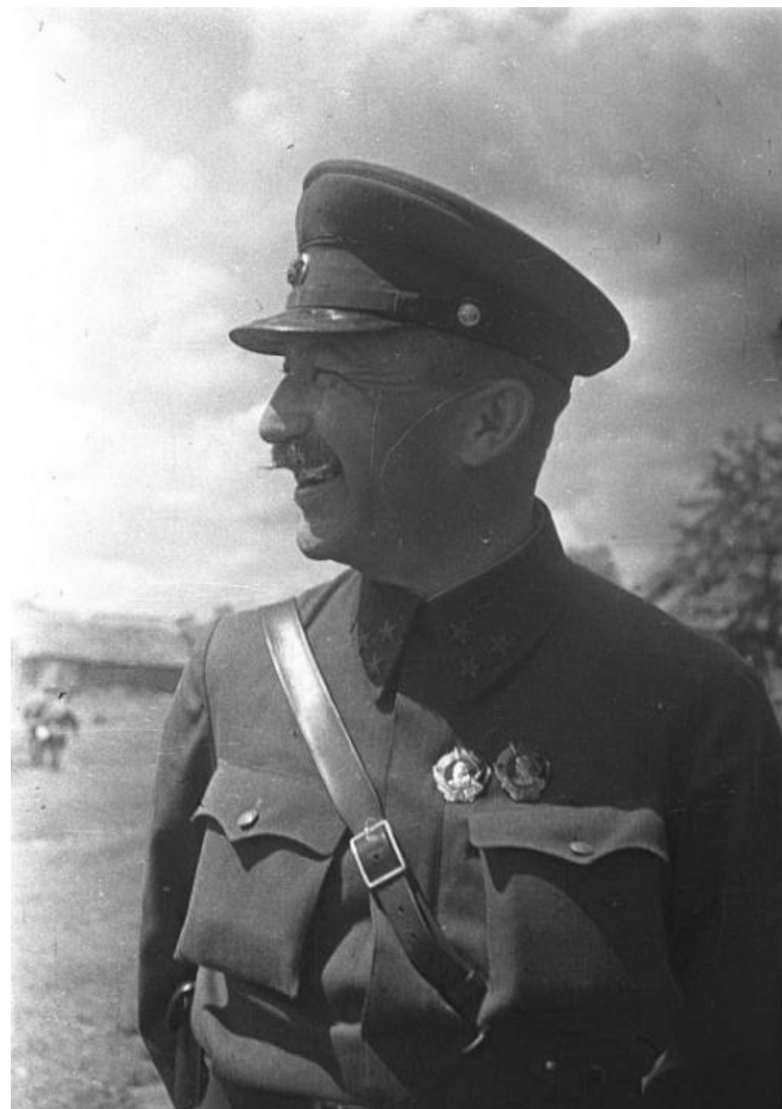
Генерал-майор П. А. Белов

27—30 ноября контрудар силами 1-го гвардейского кавалеристского корпуса (командир - генерал-майор П. А. Белов) и 112-й танковой дивизии (командир - полковник А. Л. Гетман) противник был отброшен на юг