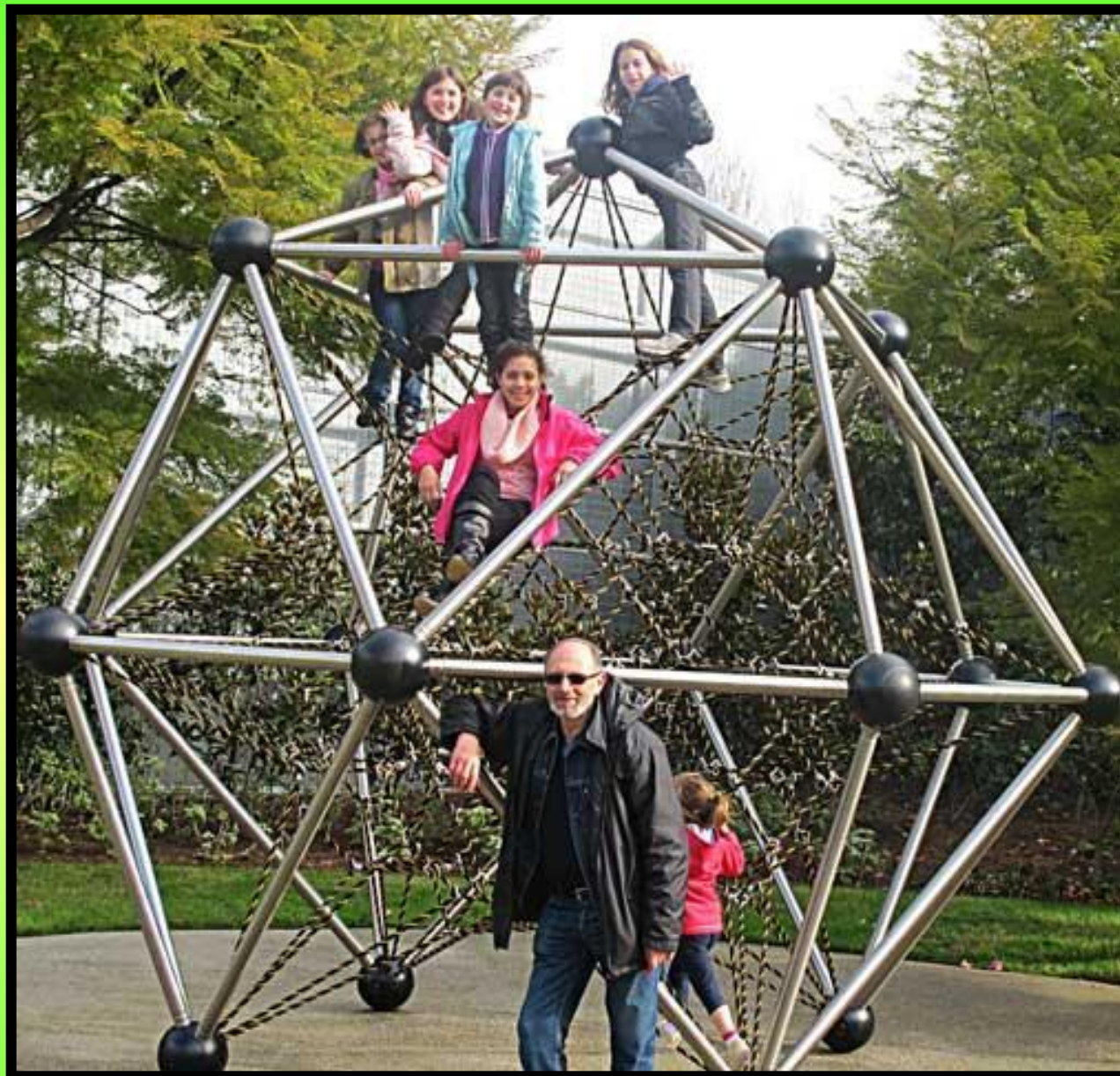
Активный отдых на игровой площадке во время ланча