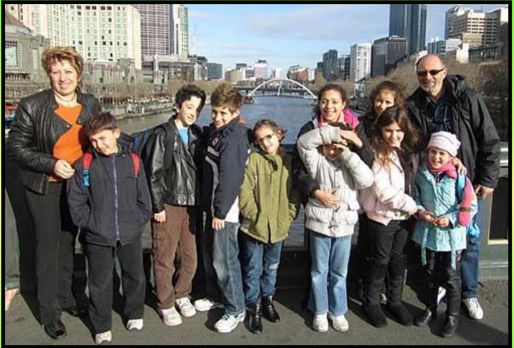
По дороге в галерею