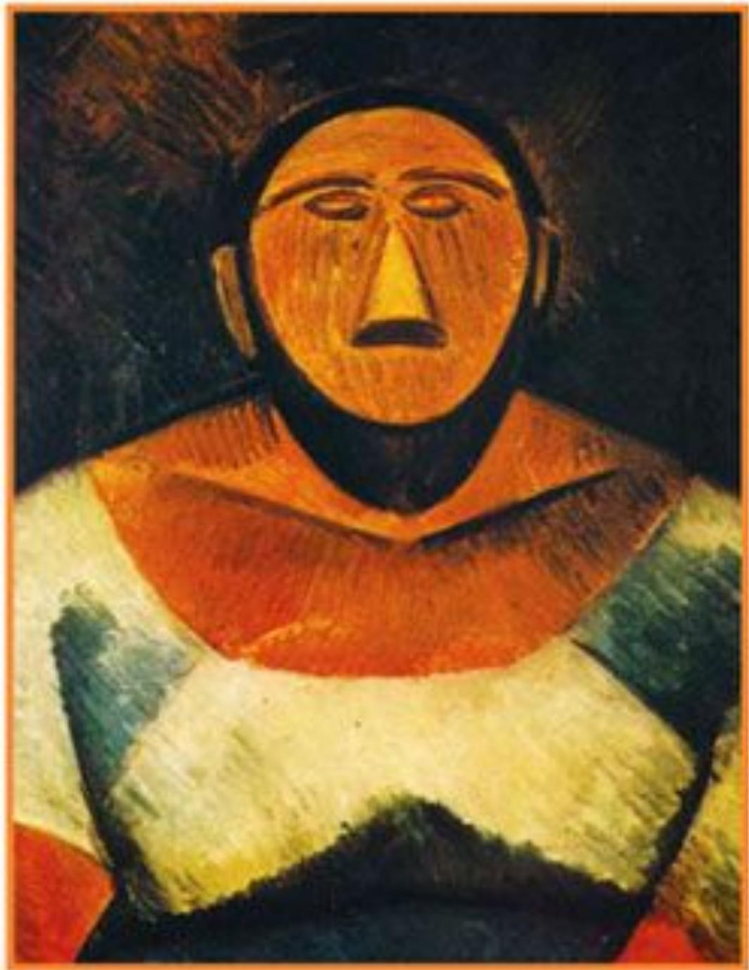
Пабло Пикассо Фермерша 1908 Государственный Эрмитаж Санкт-Петербург