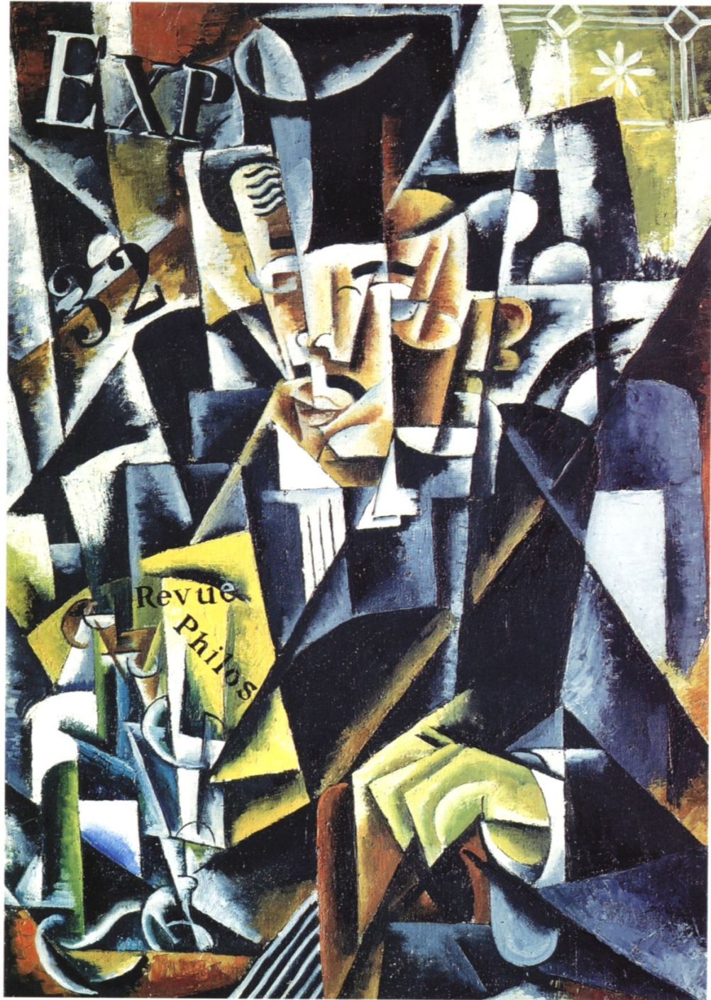
Любовь Попова Портрет философа 1915