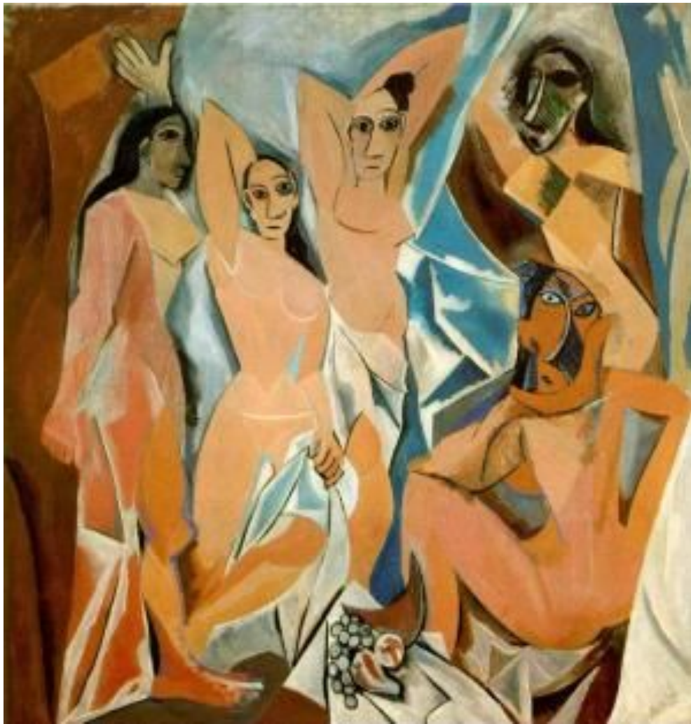
Пабло Пикассо Авиньонские девицы 1907

Для объяснения кубизма привлекали математику, тригонометрию, химию, психоанализ, музыку и многое другое. Но всё это — беллетристика, если не сказать - глупость.