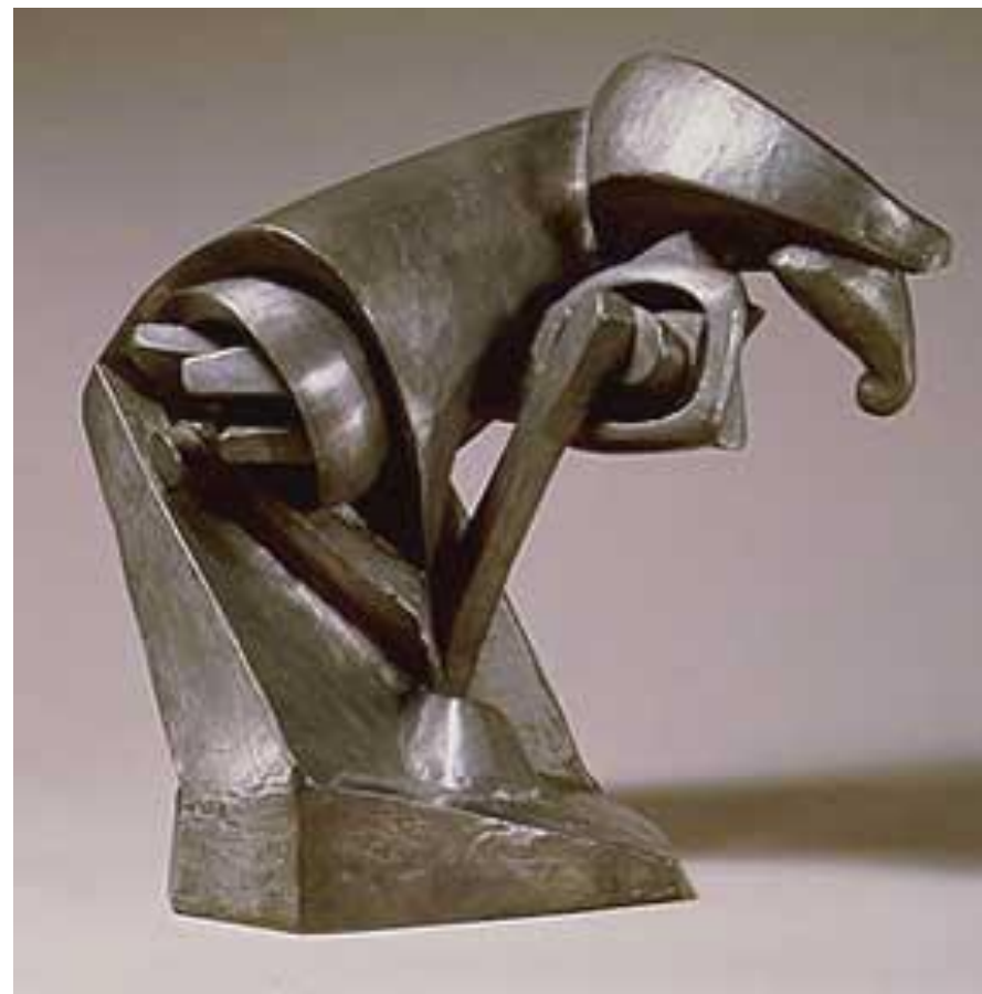
Раймонд Дюшан - Вийон Лошадь 1914