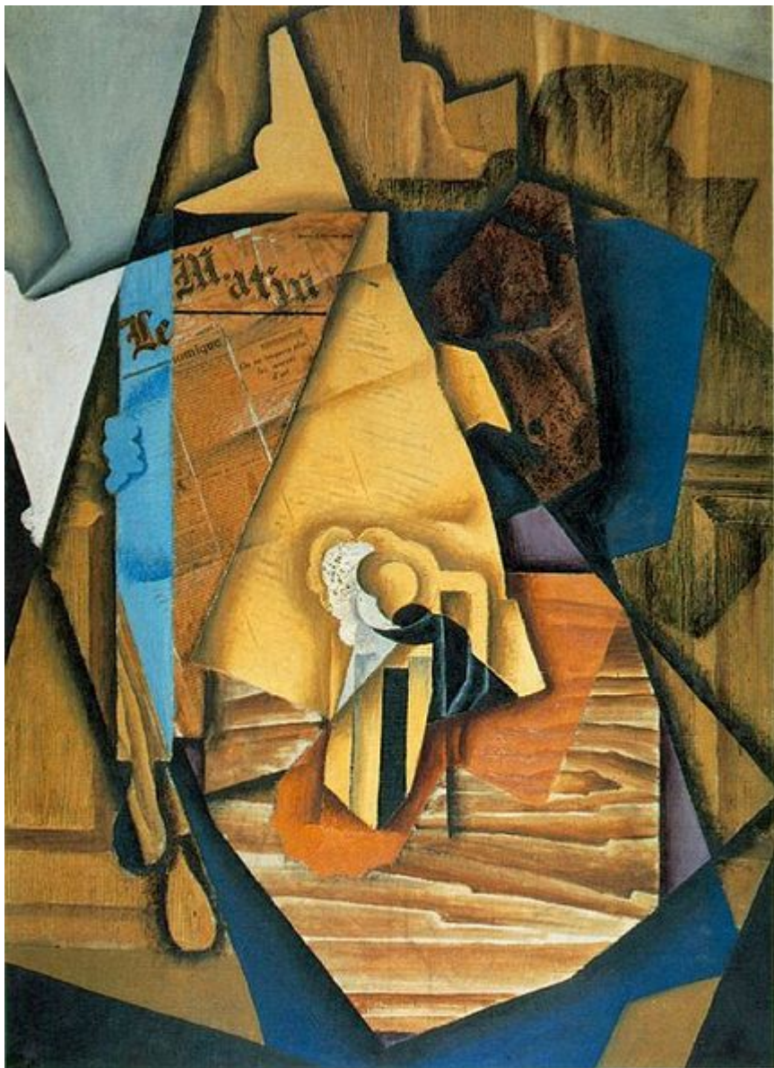
Хуан Грис Мужчина в кафе 1914