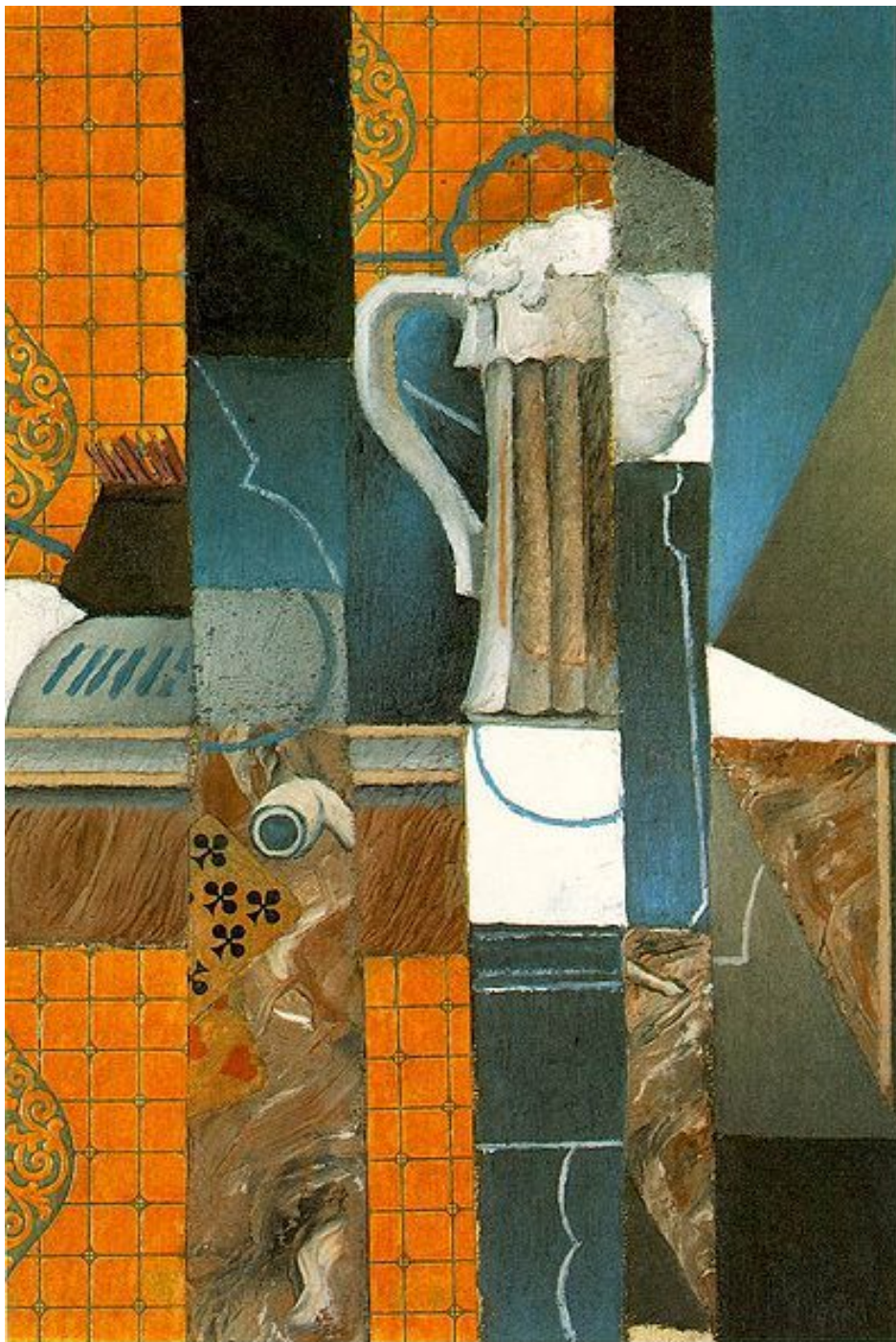
Хуан Грис Кружка пива и карты