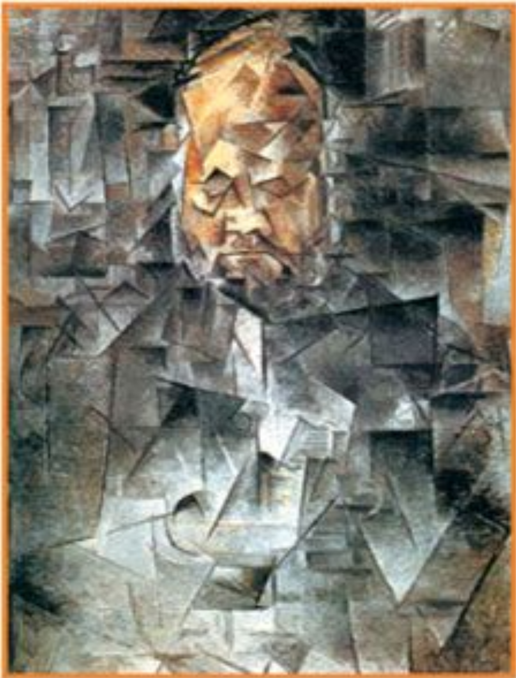
Пабло Пикассо Портрет Амбруаза Воллара 1910 Пушкинский музей Москва