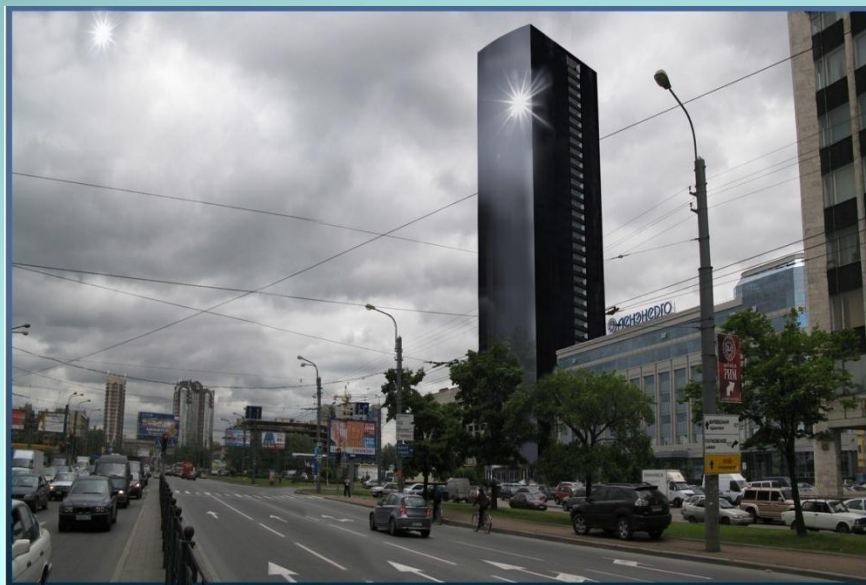
Многофункциональное административное здание Санкт-Петербург, Ленинский пр. д. 153, литер В