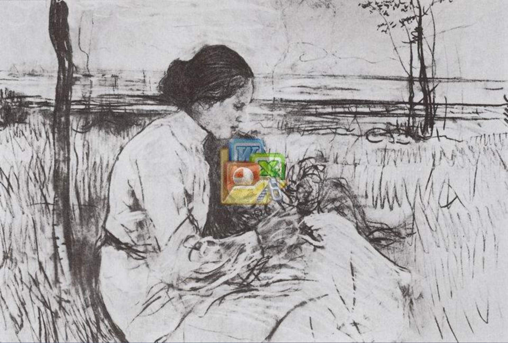
В. Серов. «Мама с ребёнком»