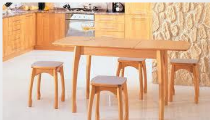
Стол и табуретки