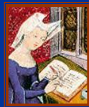
Кристина де Пизан

Кристина де Пизан в своей книге опровергала обвинения ученых мужей против женской природы. Она считала, что образование является основным средством для освобождения от угнетения.