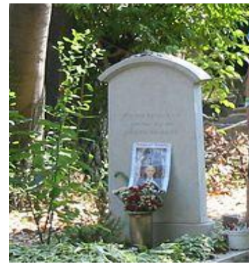
Общий вид могилы в Венеции, остров Сан-Микеле, 2004