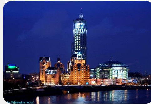
Современные здания Торговые комплексы