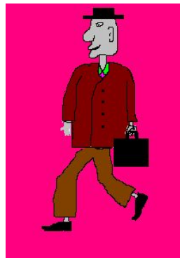
Это папаны рисунки.