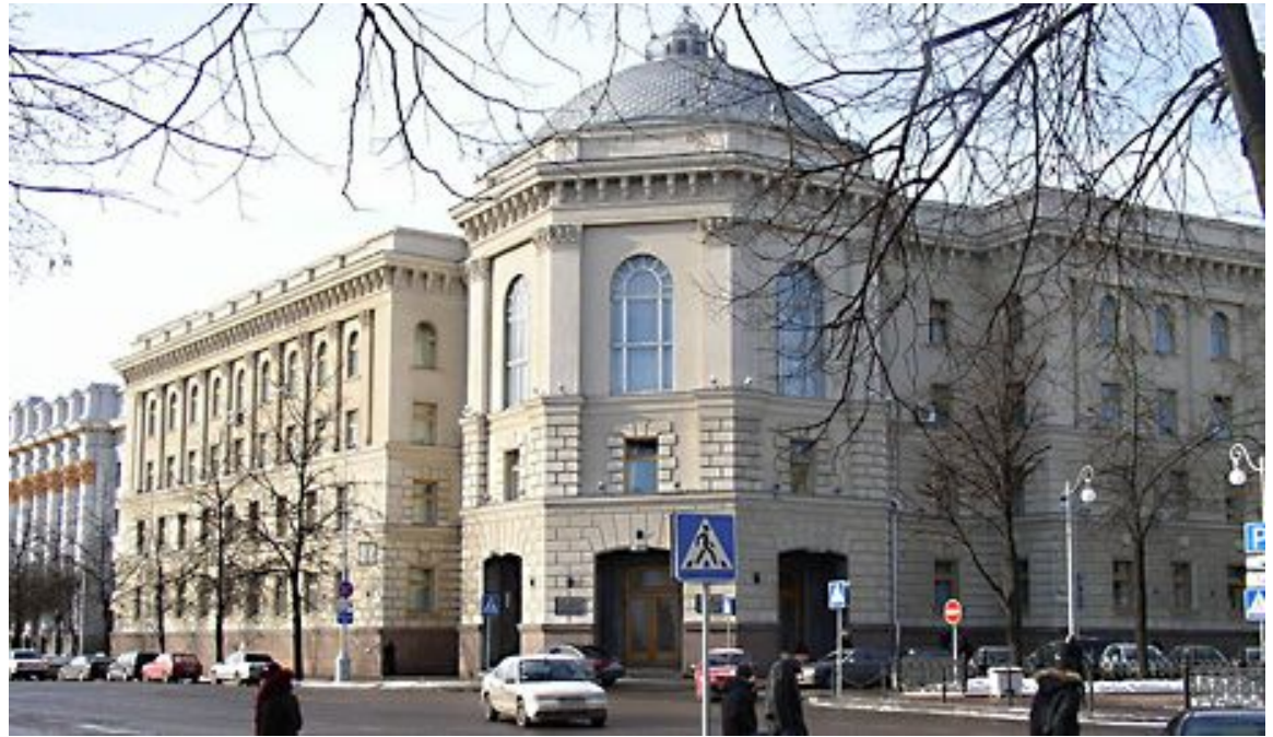
Штаб квартира СНГ в Минске