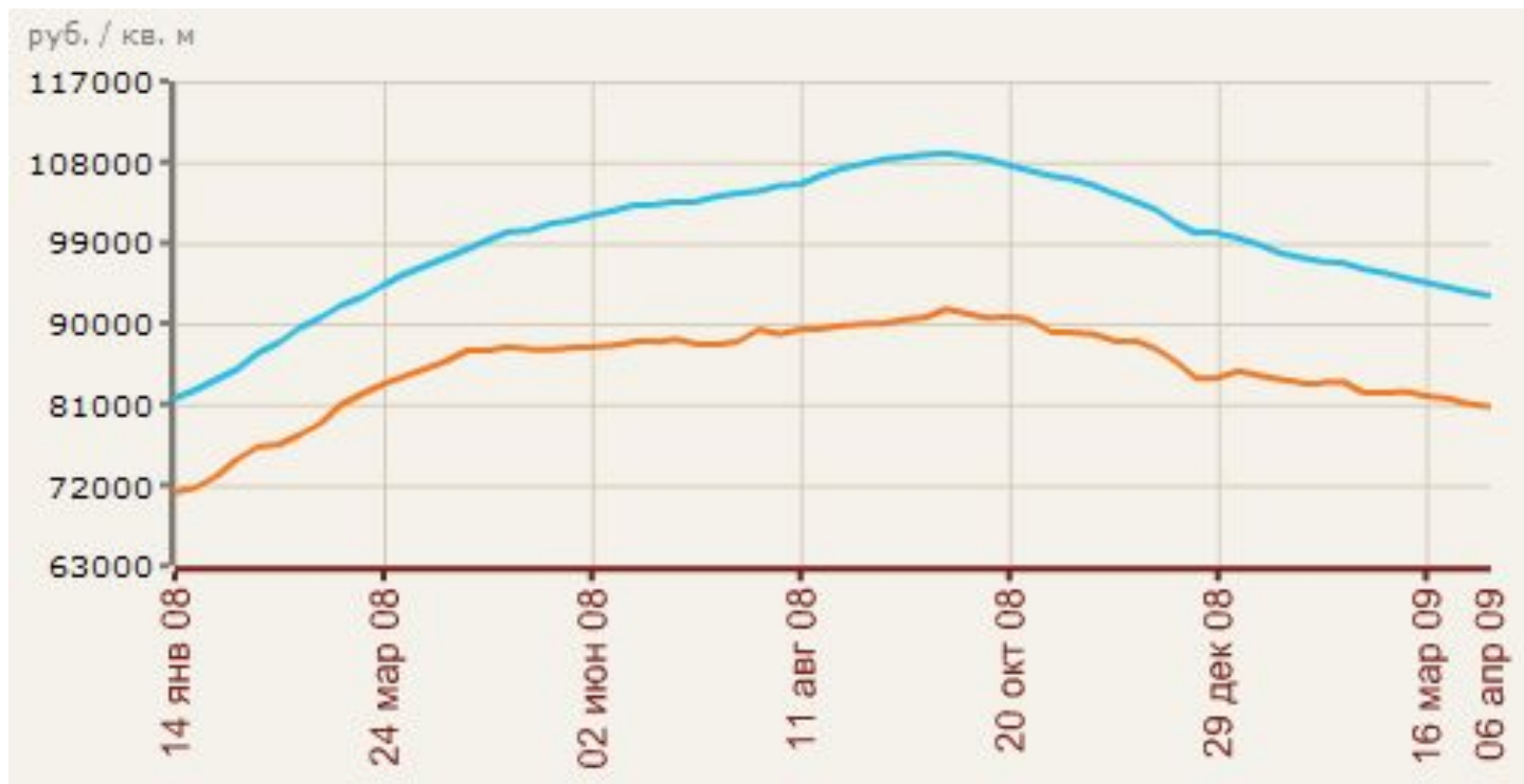
График изменения цен за год