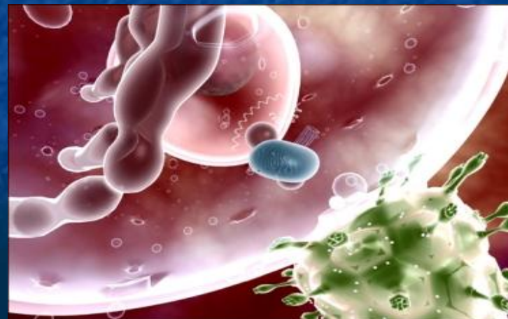
...и половой контакт