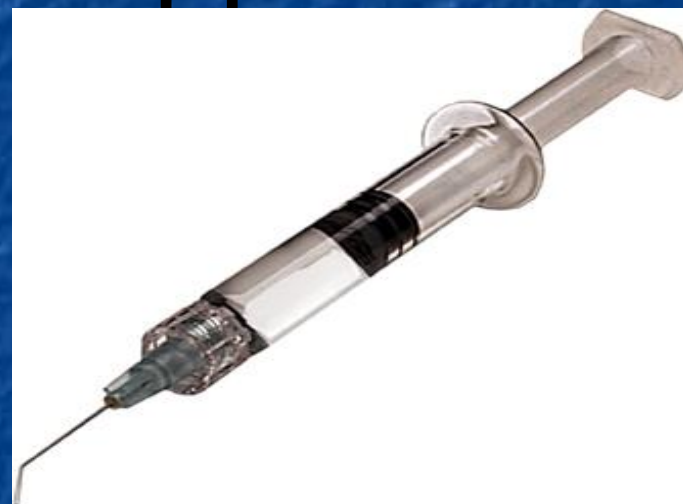
Заражение СПИДом возможно через шприц наркомана...

Синдром приобретённого иммунного дефицита — состояние, развивающееся на фоне ВИЧ-инфекции и характеризующееся падением числа CD4+ лимфоцитов, множественными оппортунистическими инфекциями, неинфекционными и опухолевыми заболеваниями.