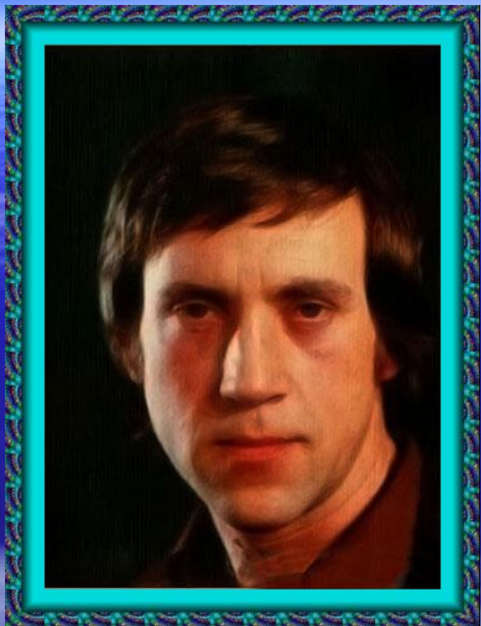
Владимир Семёнович Высоцкий ( 1938-1980 )