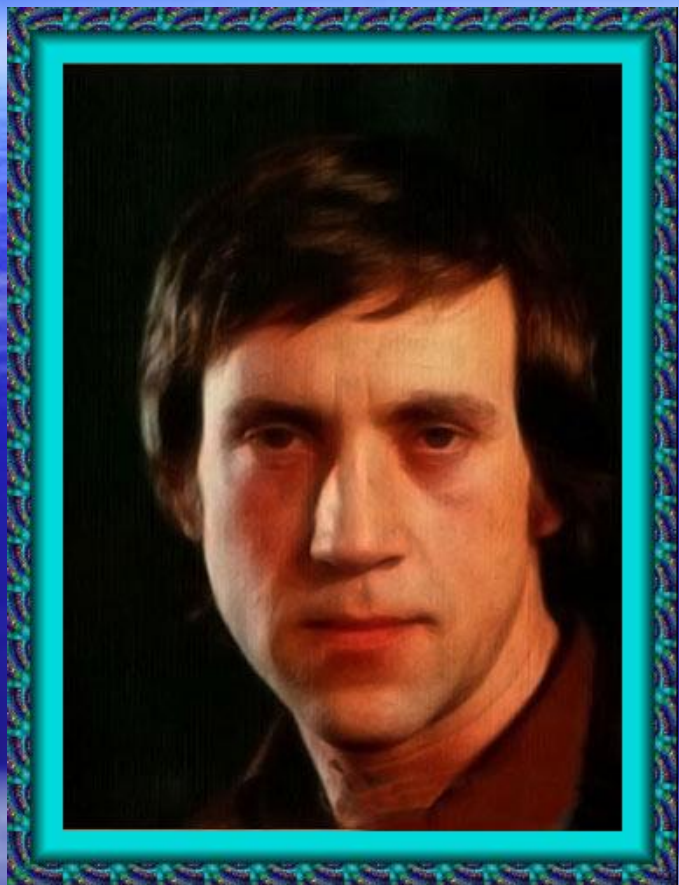
Владимир Семёнович Высоцкий ( 1938-1980 )