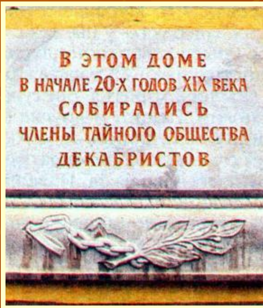
Мемориальная доска В Москве.

Восстание положило начало освободительному движению против самодержавия в России.