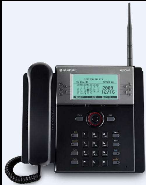
LWS-BS (Base station)