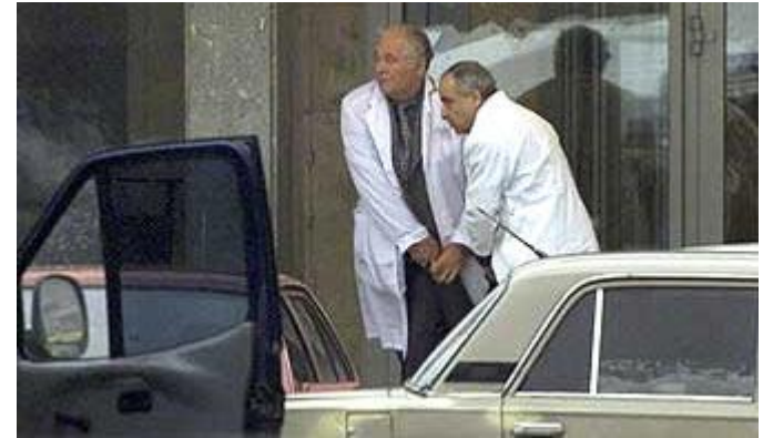
Доктор Рошаль, который вел переговоры по освобождению заложников в школе города Беслан

Кроме этого помогал детям, пострадавшим во время революций в Румынии, войн в Ираке (1991), Югославии, Палестинской автономии, Чечне, а также во время землетрясений в Японии, Египте, Афганистане (1998), Турции (1999) и Индии (2001). Вёл переговоры с террористами во время террористического акта на Дубровке (2002): благодаря участию Рошалья из здания Театрального центра были выведены восемь детей, а заложникам были переданы вода и медикаменты. Также вёл переговоры с террористами во время террористического акта в Беслане (2004). Рошаль выступал против войны в Чечне и ареста Михаила Ходорковского.