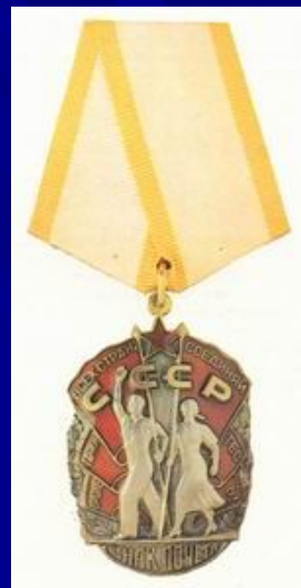
орденом Знак Почета