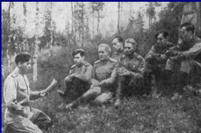
Заседание комсомольского бюро