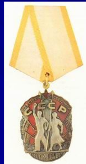
орденом Знак Почета