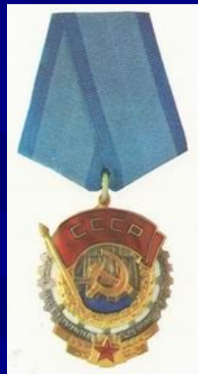
два ордена Трудового Красного Знамени