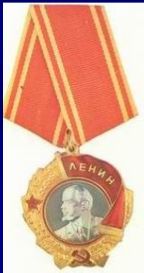
два ордена Ленина