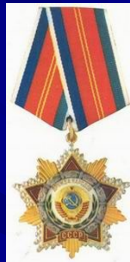
орденом Дружбы народов