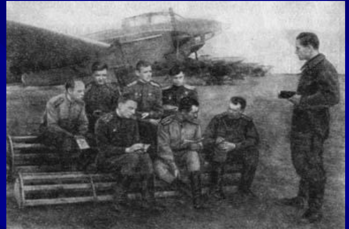
Партийное собрание в авиационном подразделении