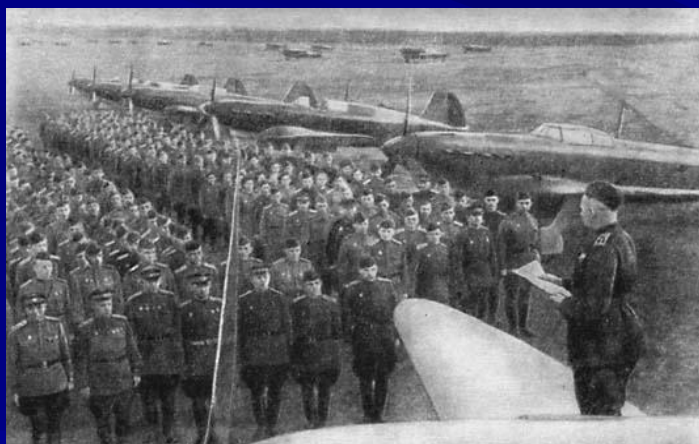
Чтение благодарственного приказа Верховного Главного командования за отличную боевую деятельность