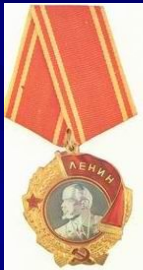
два ордена Ленина