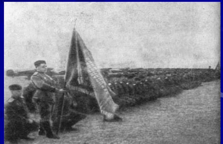
Коленопреклоненный строй гвардейцев