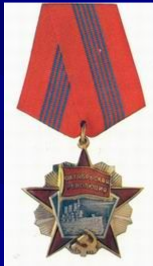
орденом Октябрьской Революции