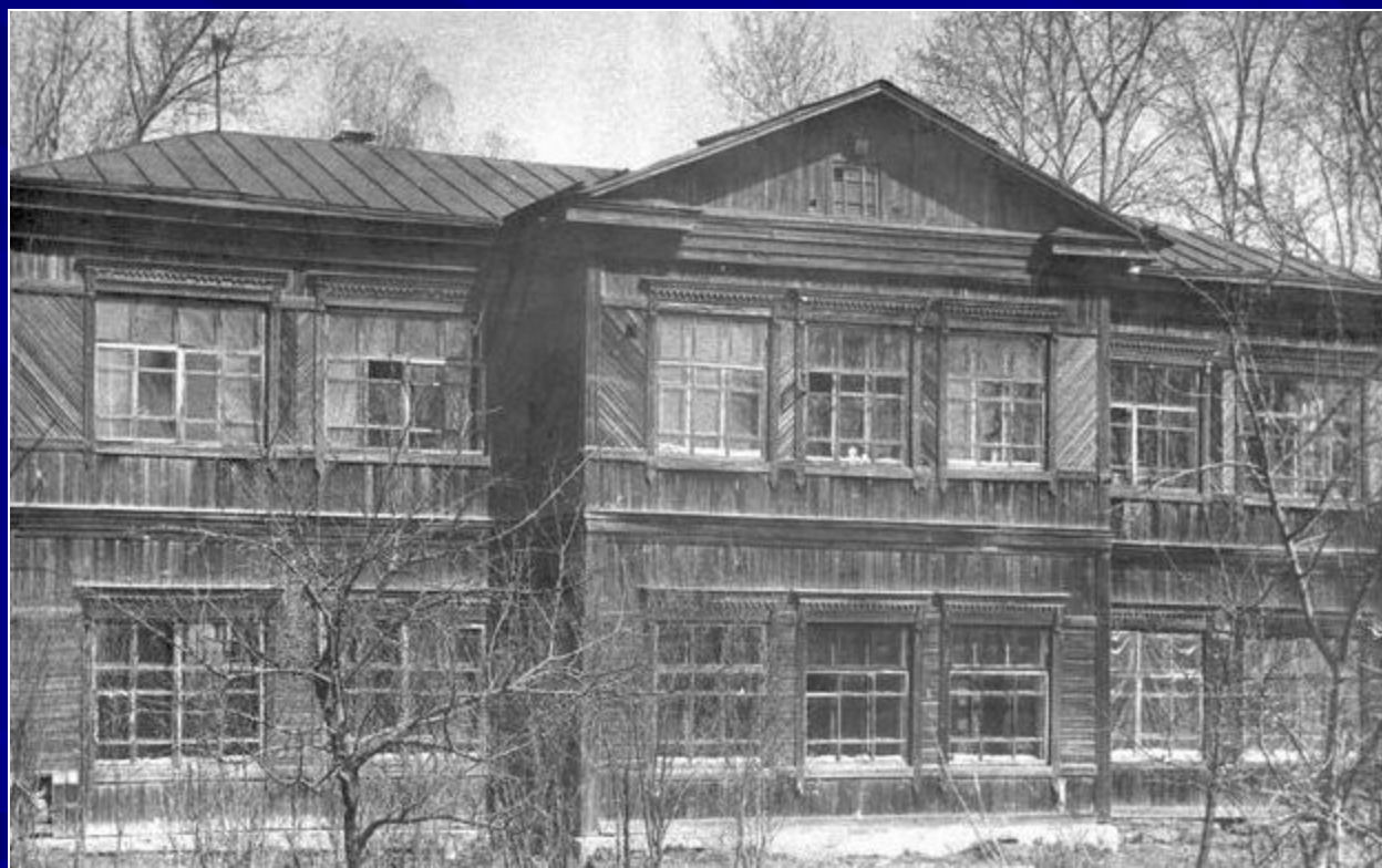
Здание летной школы.

Он обморозил ступни ног и их пришлось ампутировать. Однако летчик решил не сдаваться. После ампутации голеней обеих ног освоил протезы и заново учился управлять самолетом в Ибресинской летной школе.