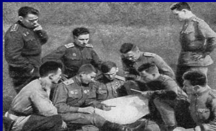
Руководящий состав 63-го гвардейского истребительного авиационного полка, где служил автор, за изучением боевого задания