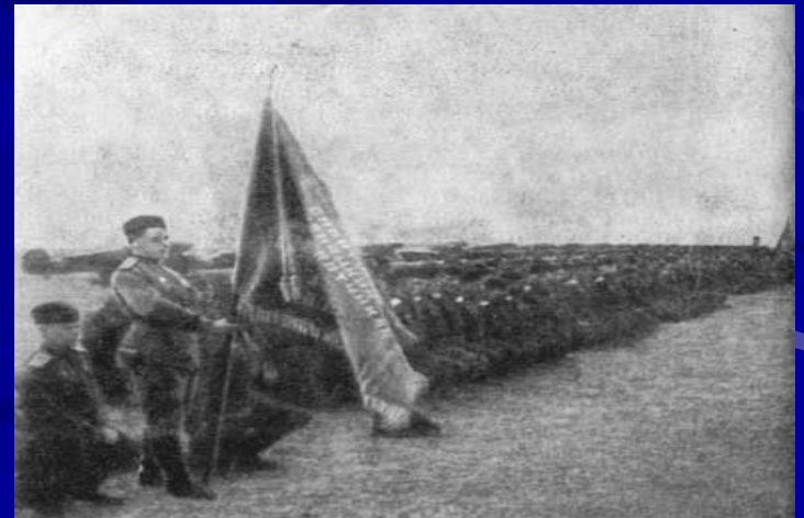
Коленопреклоненный строй гвардейцев