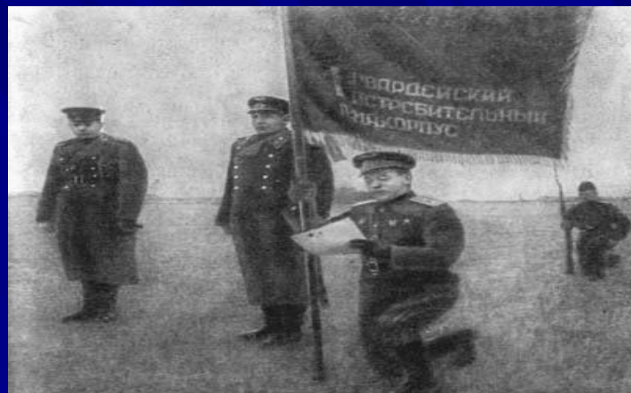
...Генерал-лейтенант авиации Белецкий зачитывает клятву гвардейцев