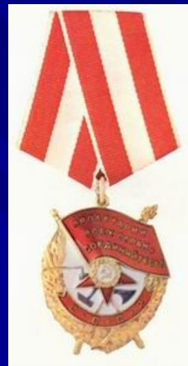
орденом Красного Знамени