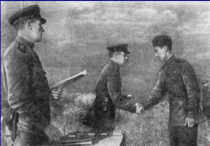
Вручение правительственной награды летчику-казаху