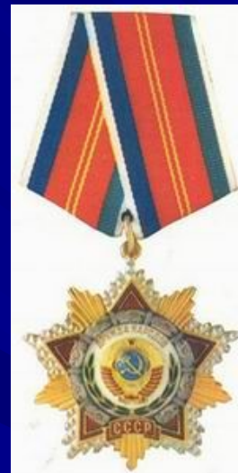
орденом Дружбы народов