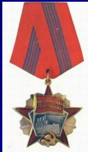
орденом Октябрьской Революции