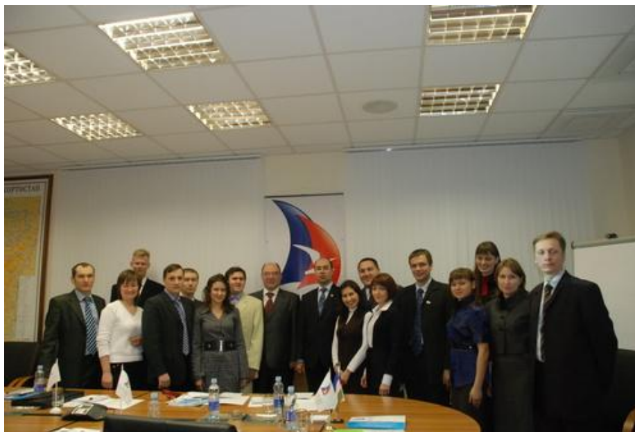
Дни молодых ученых в Республике Башкортостан

РЕГИОНАЛЬНОЕ ОТДЕЛЕНИЕ В РЕСПУБЛИКЕ БАШКОРТОСТАН