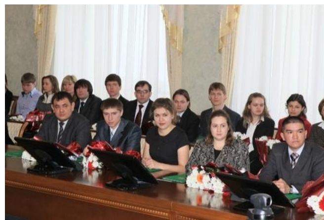
День Российской науки