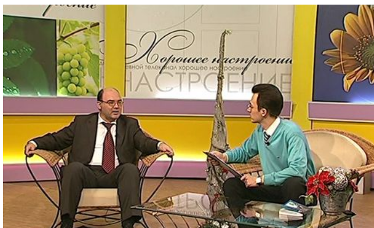
Телепрограмма «Молодежь и наука»