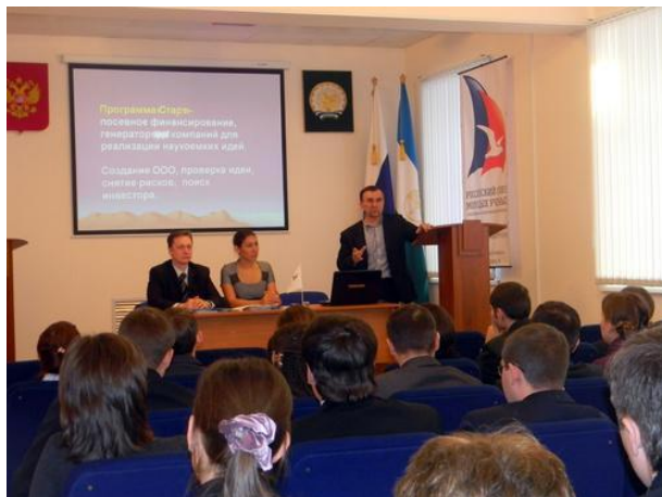
Открытый семинар «Международные и российские программы поддержки и гранты для молодых ученых»