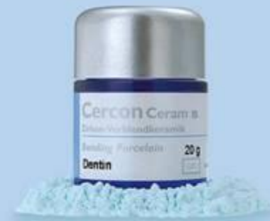
cercon ®ceram s