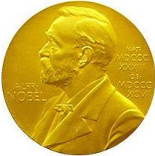
Медаль, вручаемая лауреату Нобелевской премии

В 1903 году 54-летний Павлов сделал доклад на XIV Международном Медицинском Конгрессе в Мадриде. И в следующем, 1904 году, Нобелевская премия за исследование функций главных пищеварительных желез была вручена И. П. Павлову, — он стал первым российским Нобелевским лауреатом