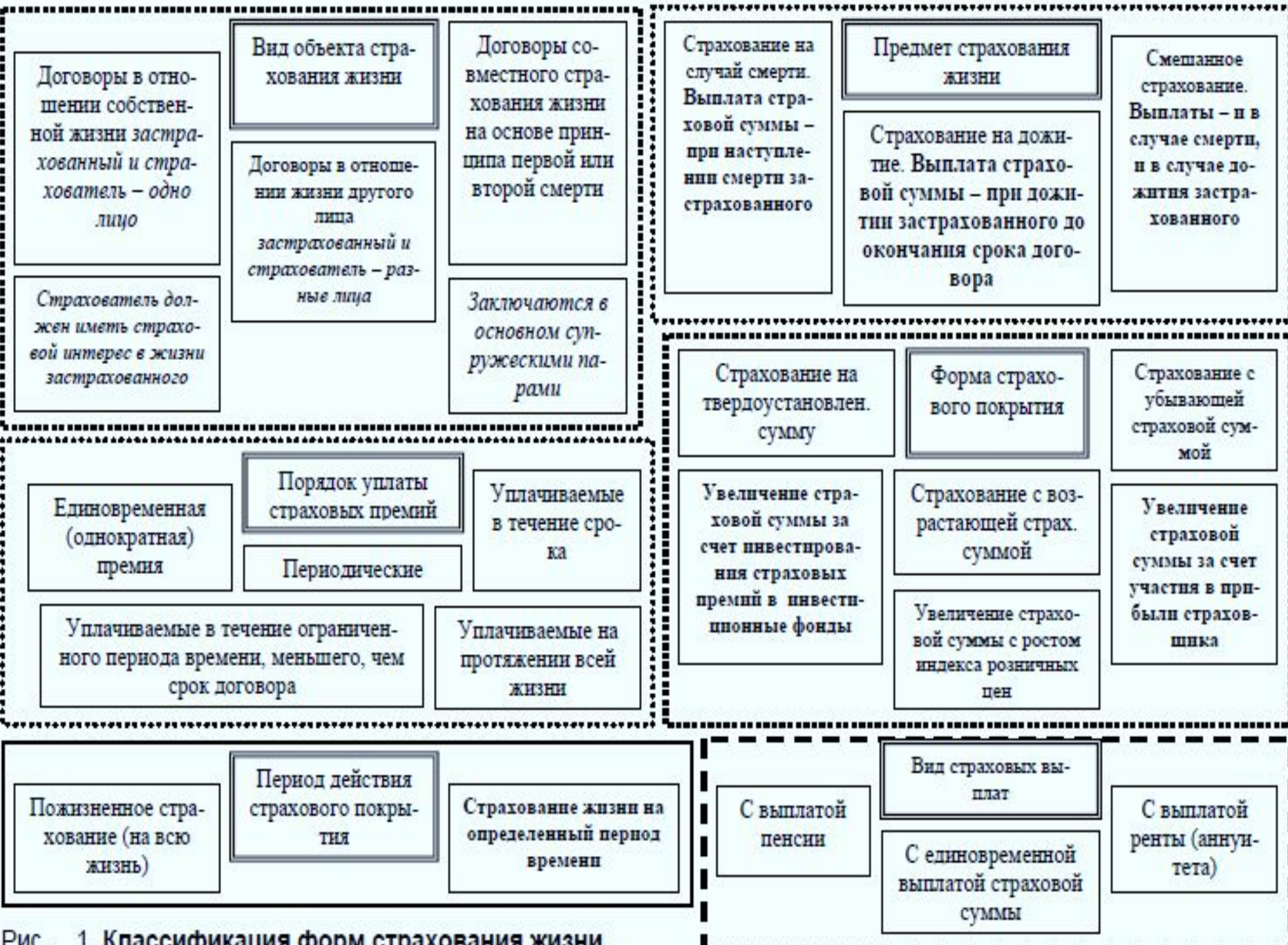
Рис. 1. Классификация форм страхования жизни