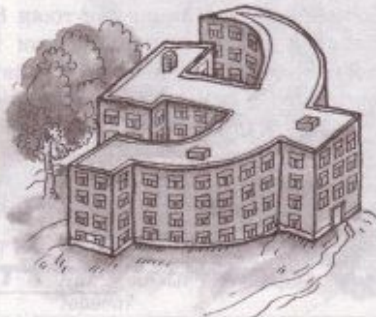
Школа имени 10-летия Октября