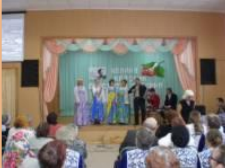
Проект «Шукшин в нашем селе»