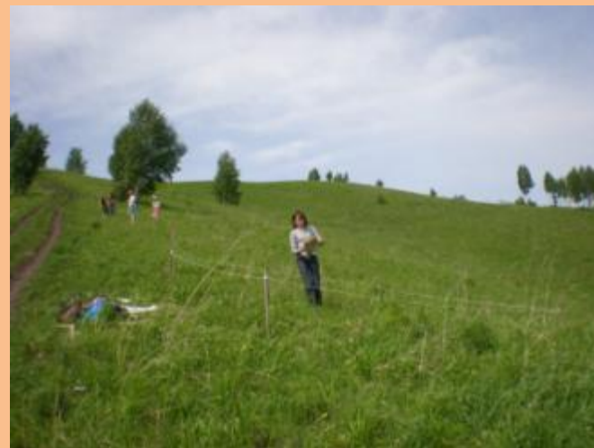
Природный парк «Ая»