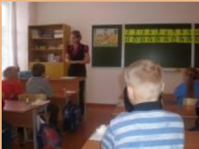
Проект «Скоро в школу»