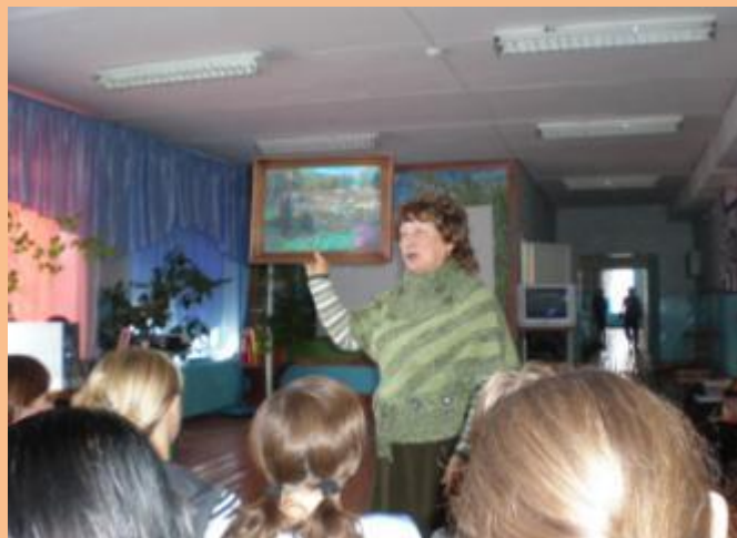
Сибирское Рериховское общество