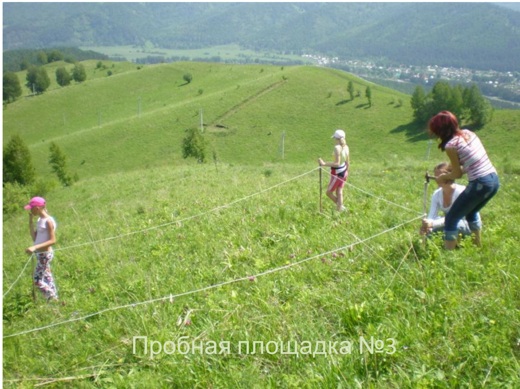
Пробная площадка №3